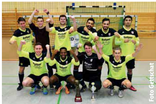
Der BSA Harburg gewann 2017 den Titel