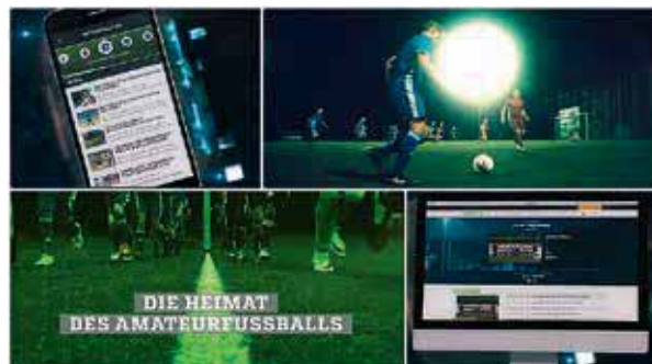
Rekordjahr für FUSSBALL.DE

Auch die Community des Amateurfußballportals wächst stetig: 2017 haben sich rund 200.000 User neu auf FUSSBALL.DE registriert, so dass nun insgesamt 785.000 Registrierungen vermeldet werden können. Die Social-Media-Kanäle von FUSSBALL.DE verfolgen ebenfalls immer mehr Nutzer: Rund 170.000 Follower sind auf Facebook, Twitter und Instagram nun dabei, das bedeutet einen Anstieg um 22,7 Prozent (2016: 138.500). Zu guter Letzt gab es auch eine Stei-