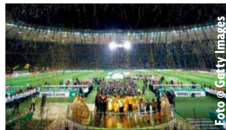
Konfetti im Olympiastadion: Am 19. Mai steigt wieder das DFB-Pokalfinale in Berlin

Können sich auch Vereine und Firmen um Tickets bewerben? Nein, an diesem Bestellverfahren können nur natürliche Personen teilnehmen (4 Tickets pro Person/Haushalt). [dfb]