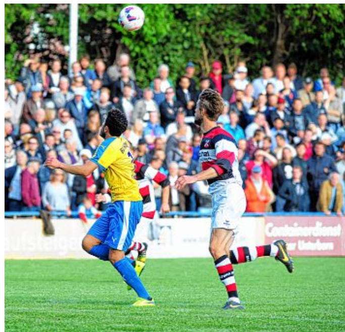
Ausverkaufter Wilhelm Rupperecht Platz.