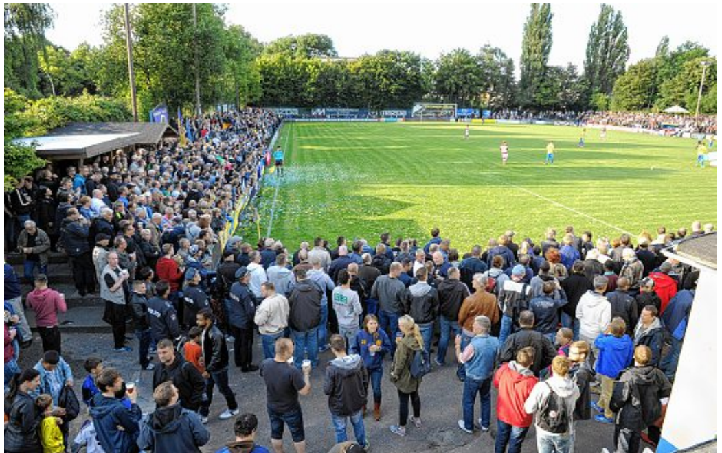
Oberliga-Saisoneneröffnung zwischen BU und Altona 93 vor toller Kulisse.

Uwe Seeler konnte sich gut an zahlreiche Spiele auf der Barmbeker Anfield erinnern und wurde mit „Uwe, Uwe“-Sprechchören gefeiert. Lotto King Karl, der schon als Junge bei BU zuschaute, blickte wehmütig zurück und erhoffte sich für den kommenden DFB-Pokal für BU mindestens den Einzug ins