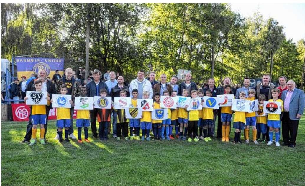
Die BU-Junioren mit den Schildern der 18-Oberliga-Vereine und den Vereinsvertretern mit Dirk Fischer und Uwe Seeler.

Schiedsrichter: Thorsten Bliesch (Niendorfer TSV) mit einer souveränen Leistung! Zuschauer: 2700 zahlende Zuschauer, also ca. 3000!