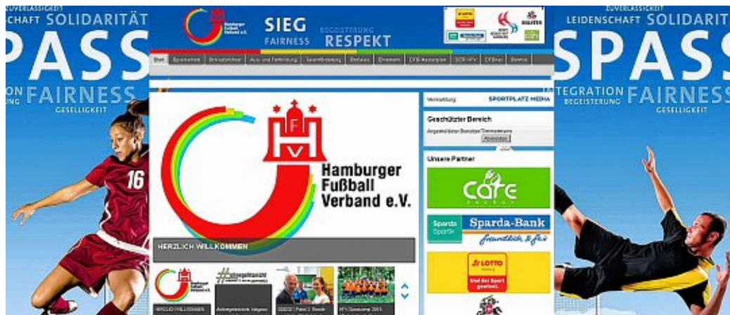
Die neu gestaltete Homepage des HFV: www.hfv.de

Schauen Sie einmal rein in die neu gestaltete Homepage des HFV unter www.hfv.de . Wir heißen Sie HERZLICH WILLKOMMEN auf der neuen Homepage des Hamburger Fußball-Verbandes. Neu ist der Partner ( deinsportplatz.de ), mit