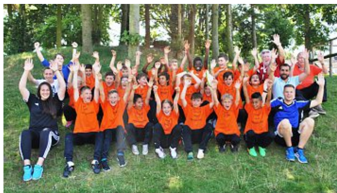
Jubel bei den Kindern, Betreuern und Trainern nach einem sehr gelungenen Sportcamp