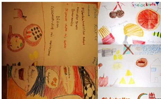
...und das gabs zu Essen im HFV-Sportcamp.