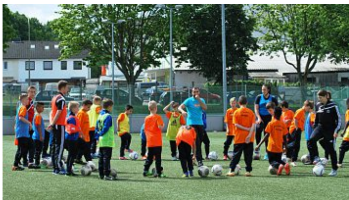
Die Kinder beim HFV-Sportcamp "Miteinander statt nebeneinander" 2015.