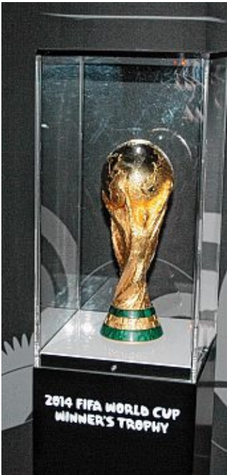
Der FIFA WM-Pokal.