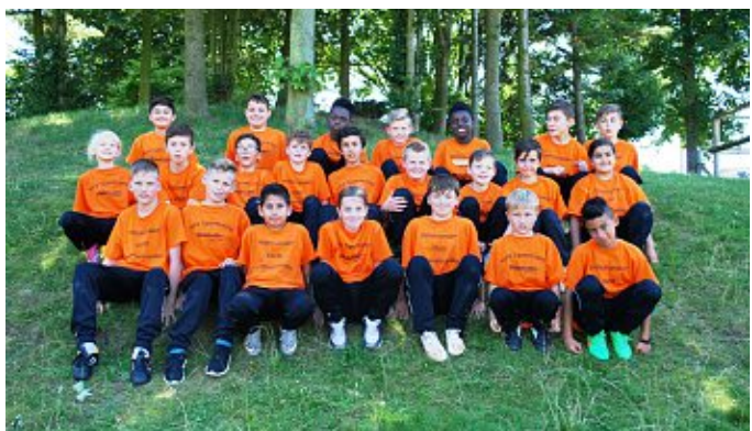
HFV-Sportcamp 2015 - Viele Fotos vom Sportcamp gibt es in der Bildergalerie auf hfv.de