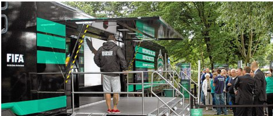
HFV Warten auf den großen Moment in Bramfeld.