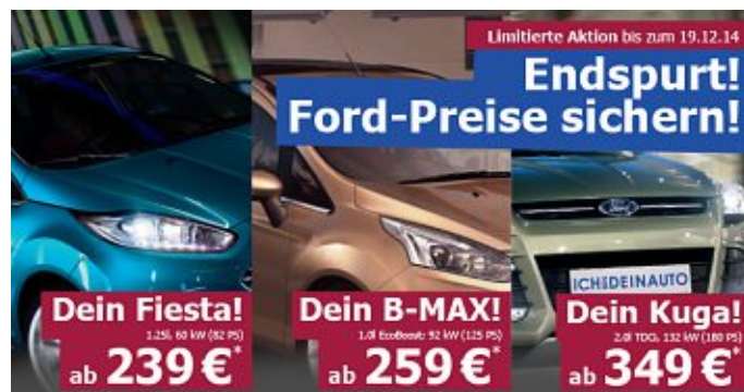
Tolles Angebot vom HFV-Partner ASS

Ihnen und Ihren Angehörigen wünschen wir ein Frohes Fest und einen guten Rutsch ins Neue Jahr! Ihr HFV-Team