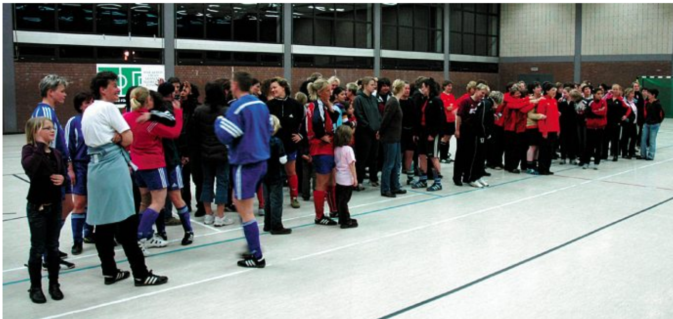
Volle Halle beim 7. Ü30-Frauen-Futsal-Turnier des HFV.

Am 22.01.2010 findet von 18 bis 22 Uhr zum 8. Mal das HFV-Ü30-Frauen-Futsal-Turnier in der Sporthalle der HFV-Sportschule in Jenfeld statt. Für das Ü30-Turnier gelten folgende Bestimmungen: Gespielt wird nach den gültigen FIFA-Futsal-Regeln, mit reduzierter Spielzeit. Eine Mannschaft besteht aus einer Torhüterin und vier Feldspielerinnen sowie bis zu sieben Auswechselspielerinnen. Die eingesetzten Spielerinnen müssen am 31.12.1979 oder früher geboren sein. Der Einsatz jüngerer Spielerinnen ist nicht möglich. Eine Zugehörigkeit zu einem Verein des HFV ist nicht erforderlich.