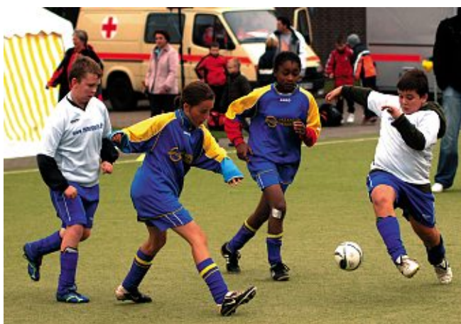
Natürlich ist das Fußballspielen ein Hauptbestandteil der Fußball-Camps.