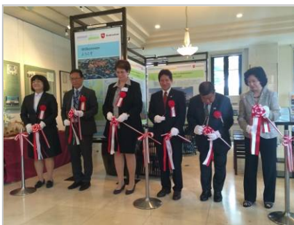
Eröffnung der Niedersachsen Ausstellung im Deutschen Haus

Am 8. Dezember war man sich in Hannover einig: Dank der Reise konnten die traditionell guten Verbindungen nach Japan gepflegt, wertvolle Einblicke erzielt und neue Partner mit Potenzial gewonnen werden.