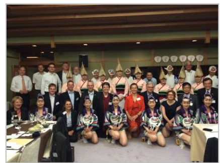
Kennenlernen beim Awa-Tanz