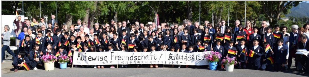
Begrüßung und Empfang durch Kinder der Grundschule Bando

In diesem Jahr besteht die Städtepartnerschaft zwischen Naruto und Lüneburg seit 40 Jahren. Die gemeinsamen Feierlichkeiten fanden im Oktober 2014 in Naruto statt, was Anlass für die 20. Delegationsreise nach Naruto war, die gemeinsam von der Hansestadt Lüneburg sowie der Deutsch-Japanischen Gesellschaft (DJG) Lüneburg organisiert wurde.