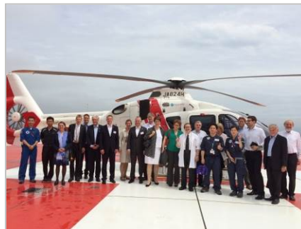
Rettungshubschrauber des Tokushima Prefectural Hospital