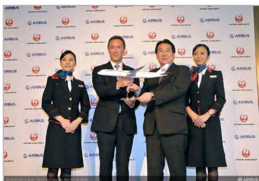
Airbus JAL A350 XWB order ceremony Airbus President and CEO Fabrice Brégier marks the A350 XWB jetliner's milestone first Japanese order with Japan Airlines President Yoshiharu Ueki

Japan Airlines sicherte sich neben den festen Bestellungen Optionen für 25 weitere A350, so dass Airbus insgesamt 56 Exemplare liefern könnte.