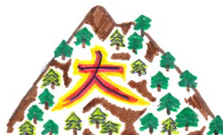
16. August: Daimonji-Matsuri

Die Stadt Kyoto ist größtenteils umgeben von Hügeln, auf denen sich große Schriftzeichen (zweimal 大 – linke Seite und rechte Seite, 妙法, 舟, 鳥) befinden, die am 16. August in kurzer Zeitabfolge in Brand gesetzt werden, ein visuelles Spektakel. Da die Zeichen in überdimensionaler Größe sind, heißt das Fest daimonji-matsuri (großes Schriftzeichen-Fest), und auf diese Weise verabschiedet man sich von den Seelen der Vorfahren.