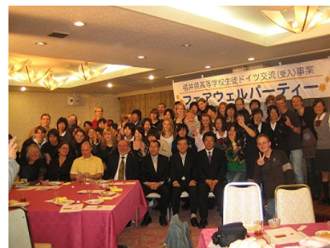
Abschiedsabend Schüleraustausch in Fukui