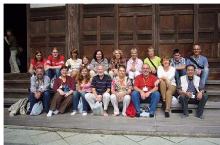
Reisegruppe in Nara