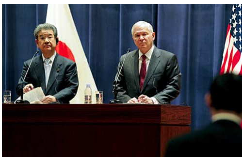
Verteidigungsminister Toshimi Kitazawa und Verteidigungsminister Robert Gates

Japan will im Umgang mit dem atomar aufgerüsteten Nordkorea eng mit den USA und Südkorea zusammenarbeiten. Darauf verständigten sich US-Verteidigungsminister Robert Gates und sein japanischer Amtskollege Toshimi Kitazawa in Tokyo. Der US-Verteidigungsminister besuchte im Anschluss an die Gespräche Südkorea zu weiteren Konsultationen. Die Schwerpunkte der Zusammenarbeit sollen die gegenseitige logistische Unterstützung der Streitkräfte bei Friedens- und Rettungseinsätzen im Ausland sein und der Austausch von wichtigen militärischen Informationen. Beide Seiten stimmten in der Einschätzung überein, dass die Militärpräsenz der USA im asiatisch-pazifischen Raum angesichts der schwierigen Sicherheitslage wichtiger geworden sei.