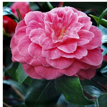
Camellia japonica ‚Palazzo Tursi‘

Die vom Botanischen Garten und Botanischen Museum Berlin-Dahlem/Freie Universität Berlin entlehene Ausstellung, die um private und öffentliche Leihgaben erweitert wurde, zeigt die Geschichte dieses Pflanzentransfers auf und stellt ausgewählte Pflanzen wie den Teestrauch, Fächerahorn, Ginkgo, die Magnolie, Kamelie, Funkie und Hortensie mit ihren botanischen Merkmalen und ihrer Nutzung vor.