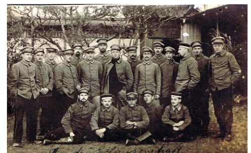
Postkarte aus dem Lager Matsuyama

nach Nachfahren unterstützt. Die Resonanz auf diesen Aufruf war unerwartet stark; in den ersten Tagen nach Erscheinen des Artikels stand mein Telefon nicht still. Söhne und Töchter oder Enkelkinder von Kriegsgefangenen berichteten von Fotoalben oder Kartons mit Fotos, die sie irgendwo aufgehoben hatten und die sie gern für unsere Ausstellung zur Verfügung stellen wollten. Sogar aus Frankfurt oder Berlin erreichten uns Anrufer, denen der Zeitungsartikel von Verwandten oder Bekannten aus Schleswig-Holstein zugeschickt worden war. Die nächsten Wochen werden mit Besuchen in ganz Schleswig-Holstein ausgefüllt sein, um das angebotene Material zu sichten und auf seine Verwendbarkeit für unsere Ausstellung zu prüfen. Wir freuen uns auf spannende Gespräche und neue Einblicke in ein Kapitel der historischen Beziehungen zwischen Schleswig-Holstein und Japan, das bisher noch wenig bekannt ist.