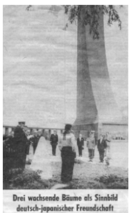
Drei wachsende Bäume als Sinnbild deutsch-japanischer Freundschaft