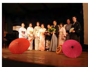
Japanischer Kulturabend in Hannover

Neben dem Austausch brachten die Delegationen aus Hiroshima neue Erkenntnisse der japanischen Lebensweise und der kulturellen Gepflogenheiten mit nach Hannover.