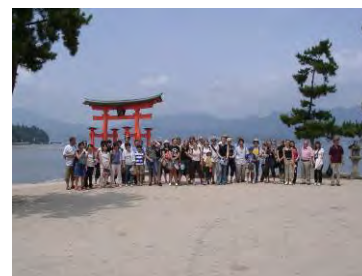
Jugendgruppe aus Hannover auf Miyajima