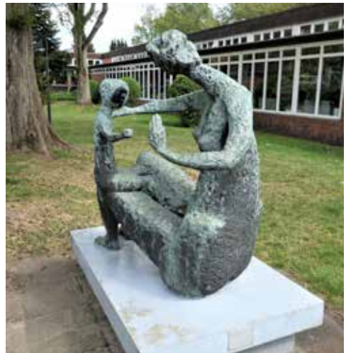
Bronze „Mutter und Kind“, geschaffen 1964 von Dorothea Buck, aufgestellt im Innenhof der Schule An der Gartenstadt in Hamburg, vor dem Verwaltungstrakt.

an den NS-Verbrechen beteiligten Eliten in der Bundesrepublik Deutschland und auch der DDR: „Dass aber 63 Jahre seit dem Ende des NS-Regimes 1945 vergehen mussten, um an die offiziell verschwiegenen und ausgegrenzten Opfer der Ausrottungsmaßnahmen erinnern zu können, liegt an der großen Täter- und Mittäterschaft der Psychiater, Theologen, aller höchsten Juristen, der Gesundheitsbehörden und Ministerien.“ [7] Sie schrieb ein Theaterstück über den hunderttausendfachen Mord an psychisch Kranken und Behinderten in der NS-Zeit. Ihre Skulptur „Mutter und Kind“ steht vor einer Schule in Hamburg-Wandsbek.