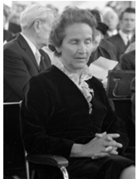
Marion Gräfin Dönhoff in der Frankfurter Paulskirche anlässlich der Verleihung des Friedenspreises des Deutschen Buchhandels am 17. Oktober 1971