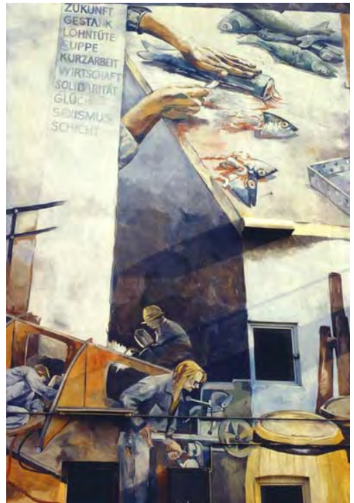
Detail aus dem Wandbild am Fischmarktspeicher, ehemals Große Elbstraße 39, Hamburg-Altona: Fischfiletiererin, Schweißerin, Metallarbeiterin. 1989 gemalt von Wiebke Hohrenk, Gisela Milse, Hildegund Schuster

Altona-Nord, seit 2016, zur Würdigung der zahlreichen Arbeiterinnen Altonas, die sich in „Männerdomänen“ wie Hafen, Fischverarbeitung, Zigarrenindustrie und Verkehrsbetrieben behaupteten, als die Gleichberechtigung von Mann und Frau rechtlich und gesellschaftlich noch nicht existierte.