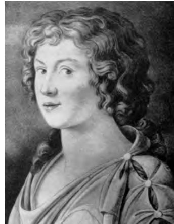
Karoline Flachsland als Psyche, nach 1770

In der Neuen Deutschen Biographie heißt es über das Wirken Karoline Herders: „Nach Herders Berufung nach Weimar 1776 öffnete sich hier für die Frau ein neuer Wirkungskreis im Kreise ihrer wachsenden Familie und der Freunde ihres Mannes; auch nahm sie an seiner amtlichen und schriftstellerischen Arbeit stets Anteil. Sie wurde die ‚Theano‘ der ‚Gott‘gespräche (1787), war auch Helferin beim Entstehen vieler Werke Herders (der ‚Volklieder‘, der ‚Ideen‘, der ‚Zerstreuten Blätter‘) und führte besonders in späteren Jahren als seine ‚Secrtaire‘ seine umfangreiche Korrespondenz. Vor allem aber galt ihre ganze Fürsorge, obwohl die früh Erschöpfte selbst oft krank war, dem alternden, hinsiechenden Manne. ‚Ohne Karoline kein Johann Gottfried Herder‘, rühmte Gleim von ihr. (...). Nach des Gatten Tode 1803 galt ihre Sorge nur noch ihren unter schwierigen Verhältnissen lebenden Söhnen, der Herausgabe von Herders sämtlichen Werken, die sie schließlich allein mit Johann Georg Müller bei Cotta seit 1805, freilich nicht ohne Mängel, durchführte, und der unermüdlchen Werbung für seine Gedanken.“ 4)