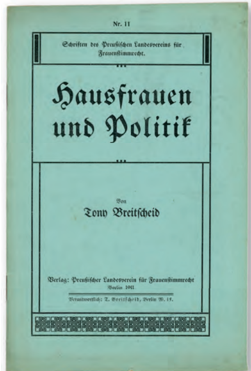
Eine der zahlreichen Schriften zum Wahlrecht für Frauen von Tony Breitscheid, erschienen 1911 in Berlin