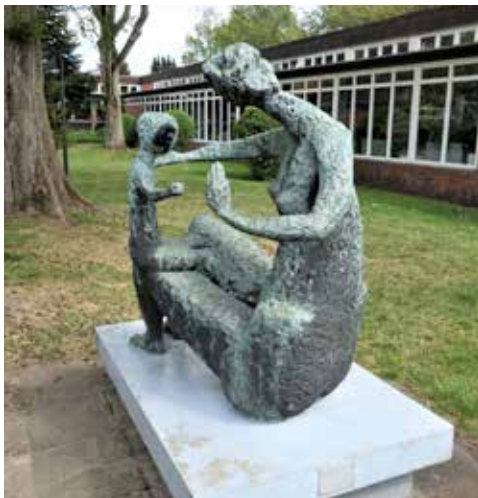
Bronze „Mutter und Kind“, geschaffen 1964 von Dorothea Buck, aufgestellt im Innenhof der Schule An der Gartenstadt in Hamburg, vor dem Verwaltungstrakt. Foto: kulturkarte.de/schirmer

nasie“-Geschädigten e.V. Sie trug mit dazu bei, dass diese Opfergruppe des Nationalsozialismus vor dem Vergessen bewahrt worden ist. Dabei erinnerte sie an die Kontinuitätslinien der an den NS-Verbrechen beteiligten Eliten in der Bundesrepublik Deutschland und auch der DDR: „Dass aber 63 Jahre seit dem Ende des NS-Regimes 1945 vergehen mussten, um an die offiziell verschwiegenen und ausgegrenzten Opfer der Ausrottungsmaßnahmen erinnern zu können, liegt an der großen Täter- und Mittäterschaft der Psychiater, Theologen, aller höchsten Juristen, der Gesundheitsbehör-