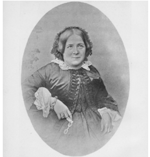
Josephine Scheffel, Josef Scheffels Mutter

Ihr Sohn Josef Viktor soll durch seine Mutter stark geprägt worden sein. Deshalb soll er einmal gesagt haben: „Wenn Sie meine dichterische Art begreifen wollen, müssen Sie