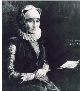
Bertha Pappenheim im Kostüm der Glikl bas Judah Leib

1910 wurden Glückels Memoiren von Bertha Pappenheim, die Gründerin des Jüdischen Frauenbundes in Deutschlands aus dem Westjiddischen ins Deutsche übersetzt und veröffentlicht.