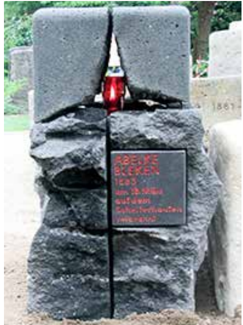
Erinnerungsstein für die Frauen, die in der Frühen Neuzeit in Hamburg als Hexen beschuldigt und hingerichtet wurden. Dies ist der einzige Erinnerungsstein in Hamburg für diese Gruppe von Frauen, aufgestellt vom Verein Garten der Frauen e. V. in ihrem gleichnamigen Garten der Frauen auf dem Ohlsdorfer Friedhof. Abelke Bleken, deren Name auf dem Stein steht und die 1583 als Hexe beschuldigt und auf dem Scheiterhaufen verbrannt wurde, steht symbolisch für all diese Frauen.

Bis 1603 wurden Frauen und Männer z. B. wegen Schadenzauber verurteilt. So wurden sie z. B. beschuldigt, das Vieh ihres Nach-