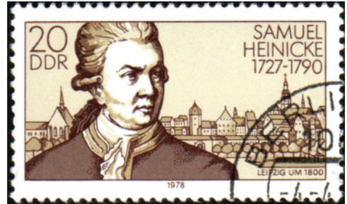
DDR Briefmarke aus dem Jahre 1978