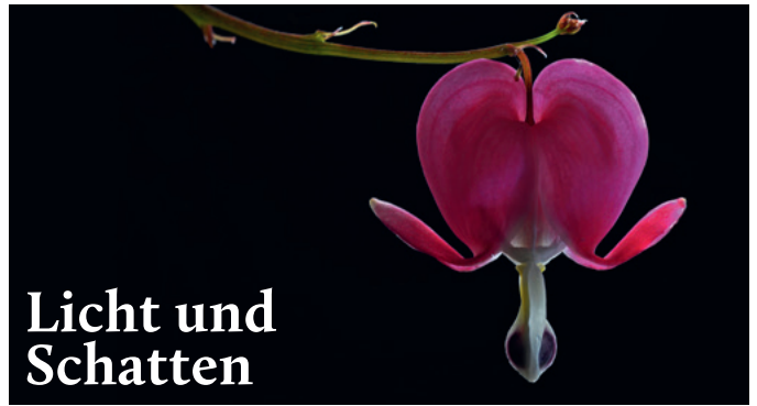
Tränendes Herz (Lamprocapnos spectabilis)

Nach über 125 Jahren schließt das Blumenhaus Reimann einen wichtigen Teil seiner Aktivitäten ab, und damit endet eine Ära, die unseren Stadtteil über Generationen hinweg verschönert und bereichert hat. Mit ihrer Blumenbinderei haben sie unzählige Momente in unserem Leben mitgestaltet. Jeder Strauß, jeder Kranz, den sie mit Liebe geschaffen haben, trug eine besondere Bedeutung und schenkte Freude und Trost in verschiedensten Lebenslagen.