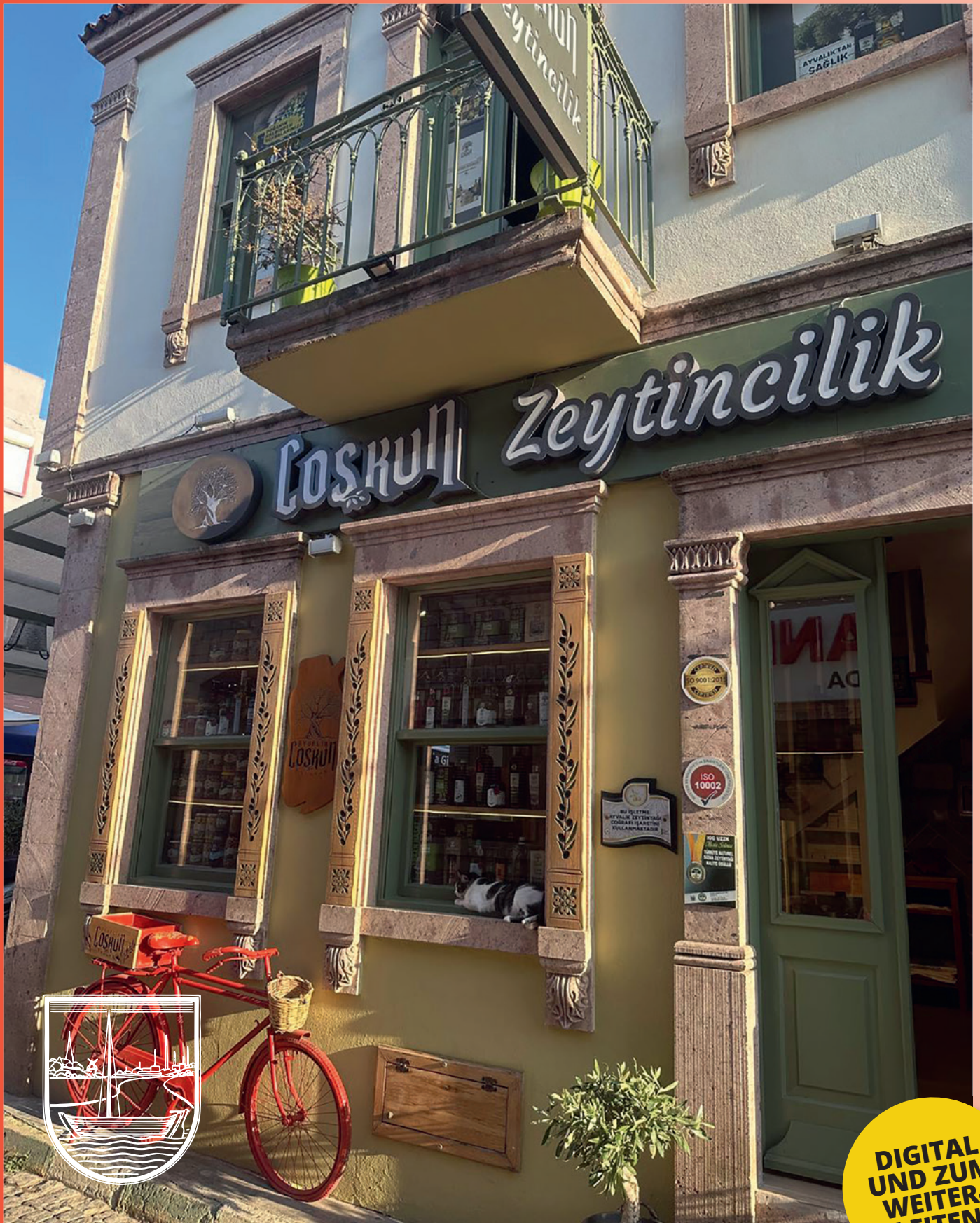
Olivenölfachgeschäft in Ayvalik, Türkei

Zeitschrift des Bürger- und Kommunalvereins Billstedt von 1904 e.V.