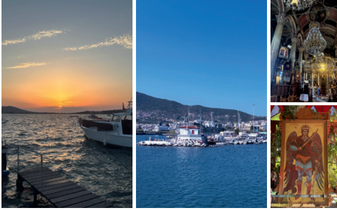
Midilli'nin limanı Ayvalık'ta gün batımı, Midilli'de bir kilisede, Başmelek Mikail Sonnenuntergang auf Ayvalık, der Hafen von Lesbos, in einer Kirche auf Lesbos, Erzengel Michael