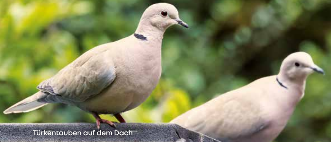
Türkentauben auf dem Dach

Partner aufgrund ihrer Standorttreue oftmals im Folgejahr erneut zueinanderfinden.