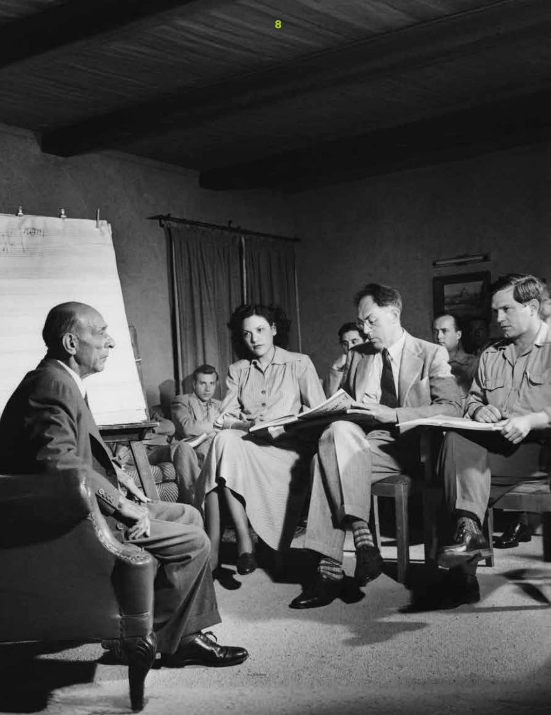
Arnold Schönberg mit Student:innen, Los Angeles, 1948