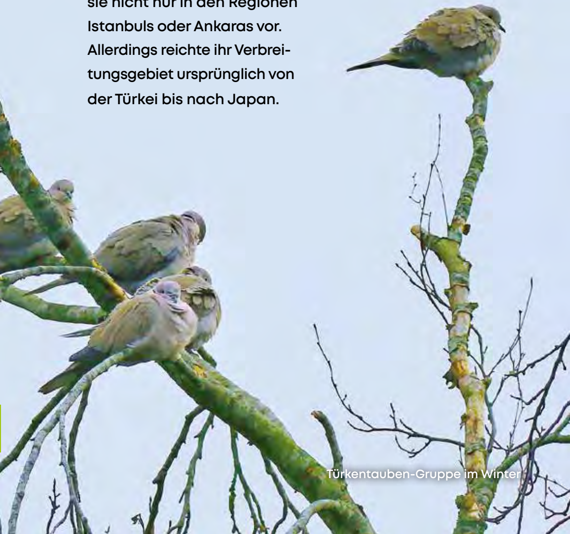
Türkentauben-Gruppe im Winter

Trotz ihres Namens kommt sie nicht nur in den Regionen Istanbuls oder Ankaras vor. Allerdings reichte ihr Verbreitungsgebiet ursprünglich von der Türkei bis nach Japan.