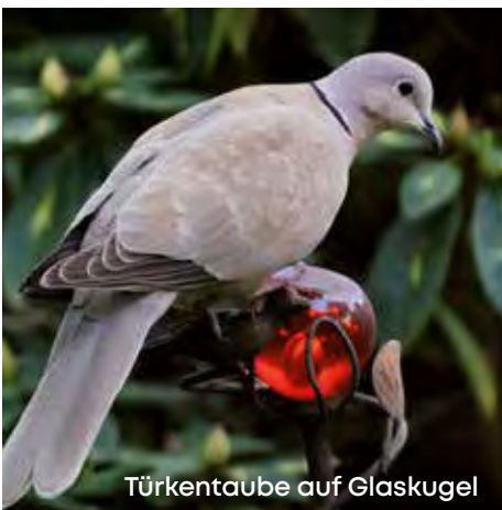
Türkentaube auf Glaskugel

In Hamburg findet man die Türkentaube nahezu ausschließlich im bebauten Stadtgebiet, insbesondere in der Gartenstadtzone, Wohnblockzone sowie in den Dörfern des Alten Landes und in den Vier- und Marschlanden. Hingegen fehlt die Art völlig in der Innenstadt, im Hafengebiet und in Wilhelmsburg. Auch die größeren Hamburger Waldgebiete sind nicht besiedelt. Schließlich bedeutet die bevorzugte Nähe zum Menschen eine sichere Versorgung mit Nahrung – sowohl durch den Getreideanbau der Landwirtschaft, als auch durch Futterhäuser in den Siedlungen.