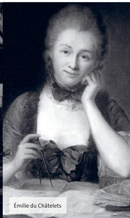
Émilie du Châtelets