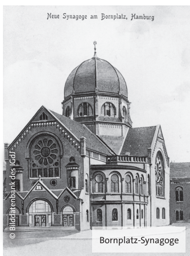
Neue Synagoge am Bornplatz, Hamburg