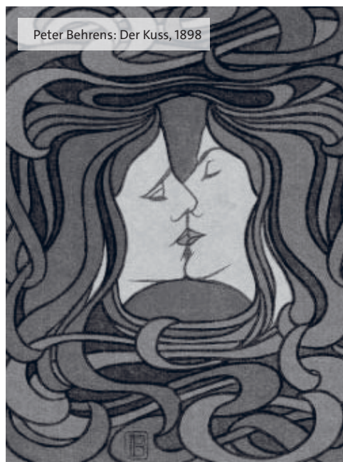
Peter Behrens: Der Kuss, 1898