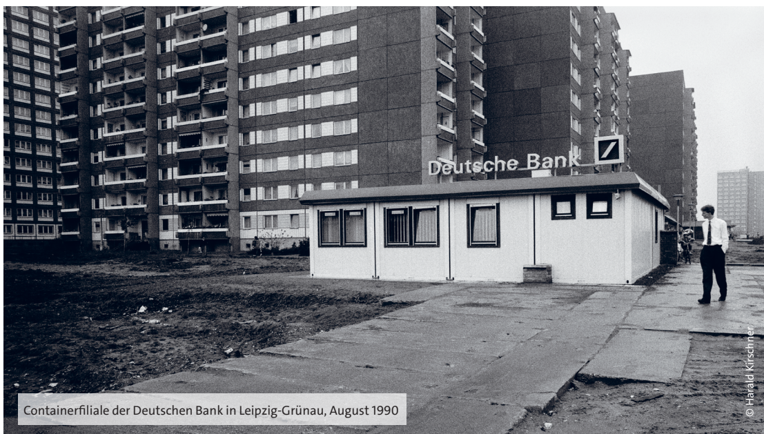
Containerfiliale der Deutschen Bank in Leipzig-Grünau, August 1990