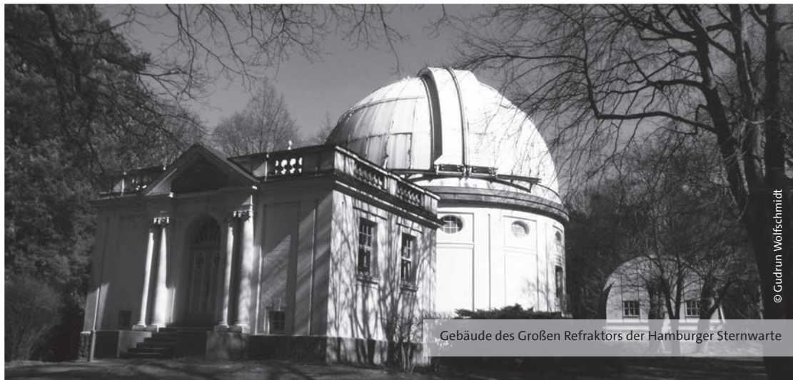
Gebäude des Großen Refraktors der Hamburger Sternwarte

21.03.18 – 15.08.18 mittwochs 20.00 – 21.30 Uhr Hamburger Sternwarte August-Bebel-Str. 196