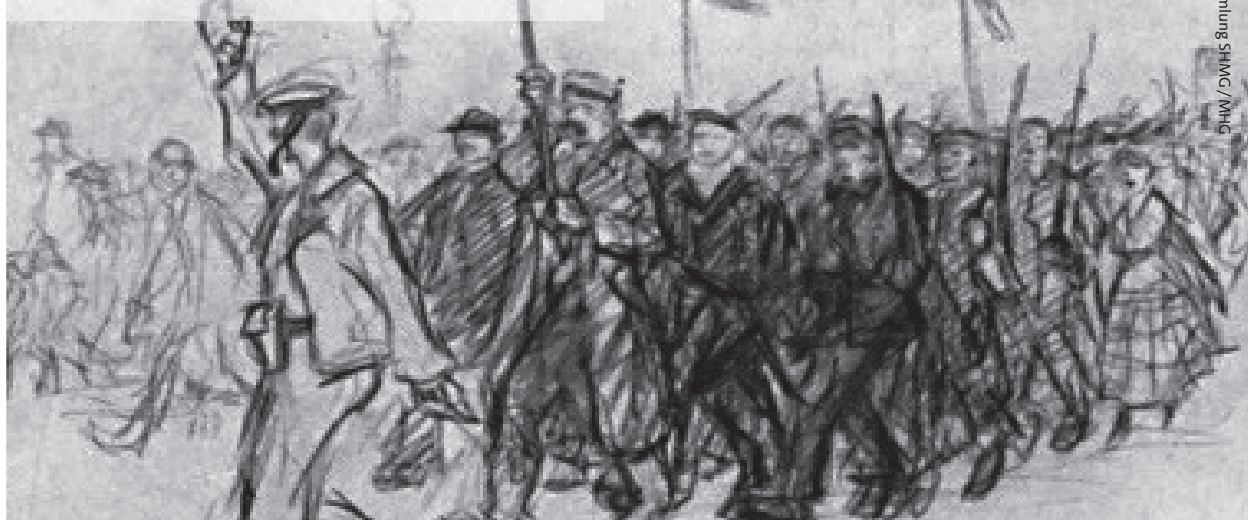
Hans Leip, Demonstration in Hamburg, 1918

18.19 Hamburg 1918.1919 Aufbruch in die Demokratie