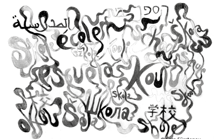
„Schule“ in vielen Sprachen