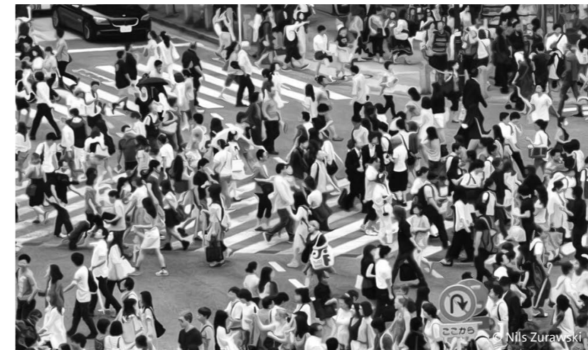
Algorithmen: Mit Daten die Massen steuern

Die Ringvorlesung will sich diesen und anderen Fragen mit ein paar ausgesuchten Vorträgen nähern und die Ideen hinter den Wünschen nach automatisierter Steuerung von Gesellschaft diskutieren, das Potenzial von Algorithmen erkunden und so zu einer differenzierten Debatte beitragen. Letztlich betrifft die digitale Verfassung der Gesellschaft alle und somit erscheint eine sachliche Aufklärung über Mittel, Ziele und Wünsche angebracht.