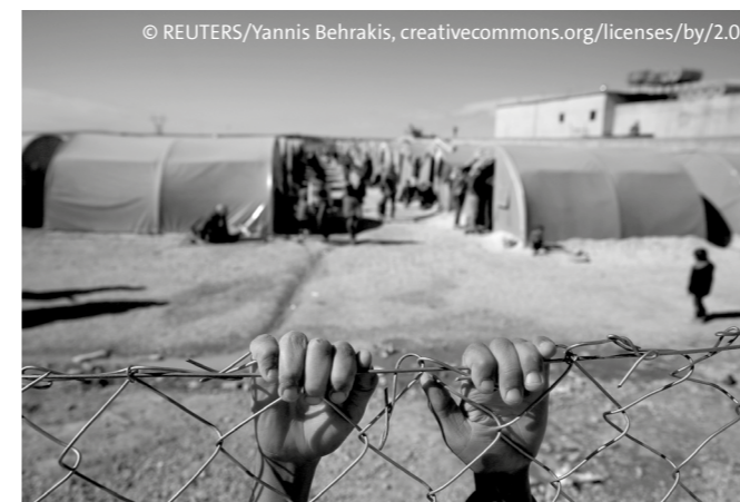
Flüchtlingslager in der türkischen Stadt Suruc (Gebiet Sanliurfa) nahe der syrischen Grenze, November 2014