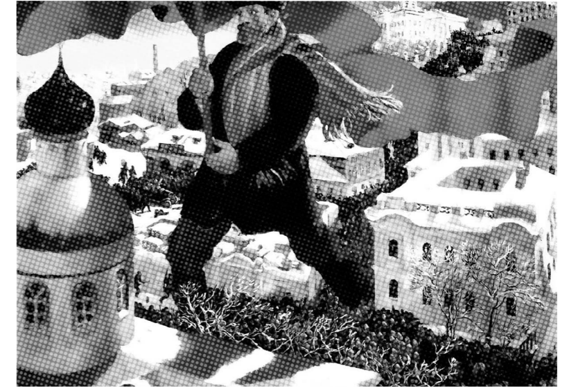
„Bolshevik“ von Boris Kustodiev, 1920 (Bild bearbeitet)