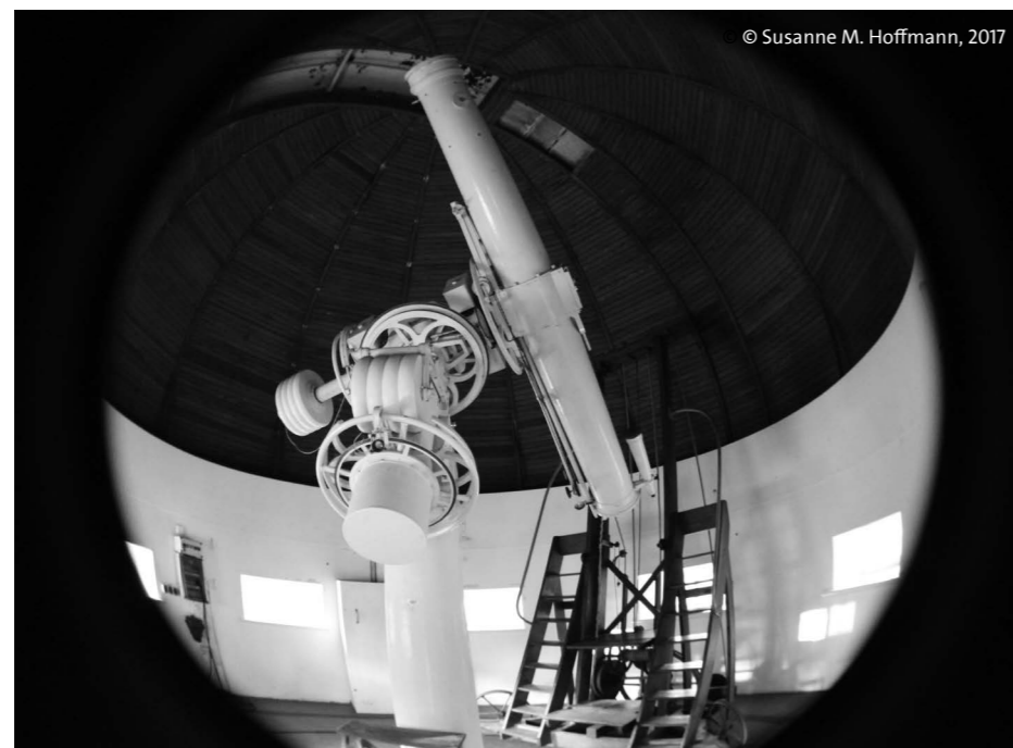
Hamburger Sternwarte, Äquatorial, Repsold, Hamburg, 1867

Weitere Termine 01.11.2017, 06.12.2017, 03.01.2018, 07.02.2018