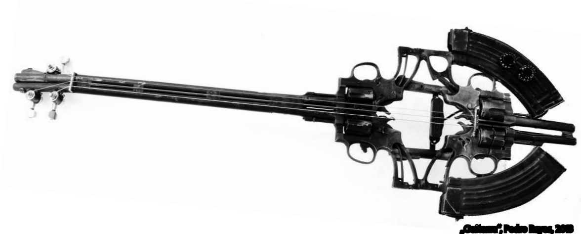
„Ottomans“, Pedro Reyes, 2008