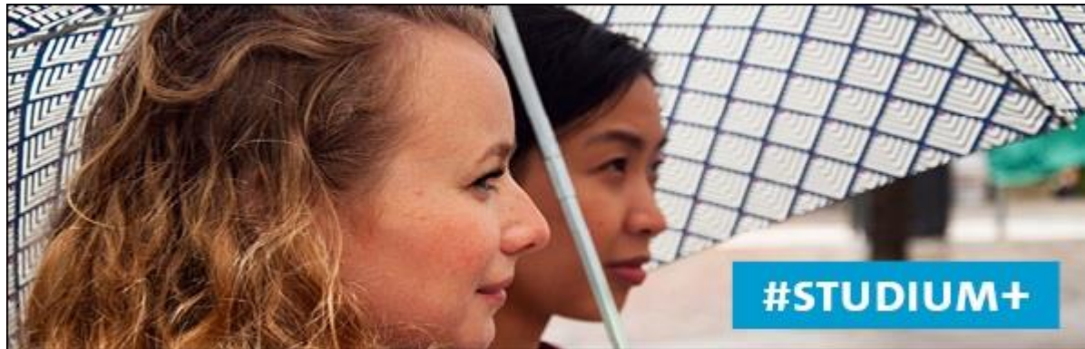
Zwei Studentinnen stehen gemeinsam unter einem Regenschirm