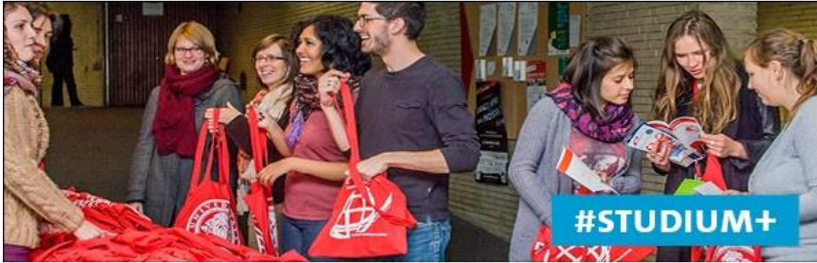
Mitarbeitende von PIASTA verteilen Ersti-Beutel in der Welcome Week