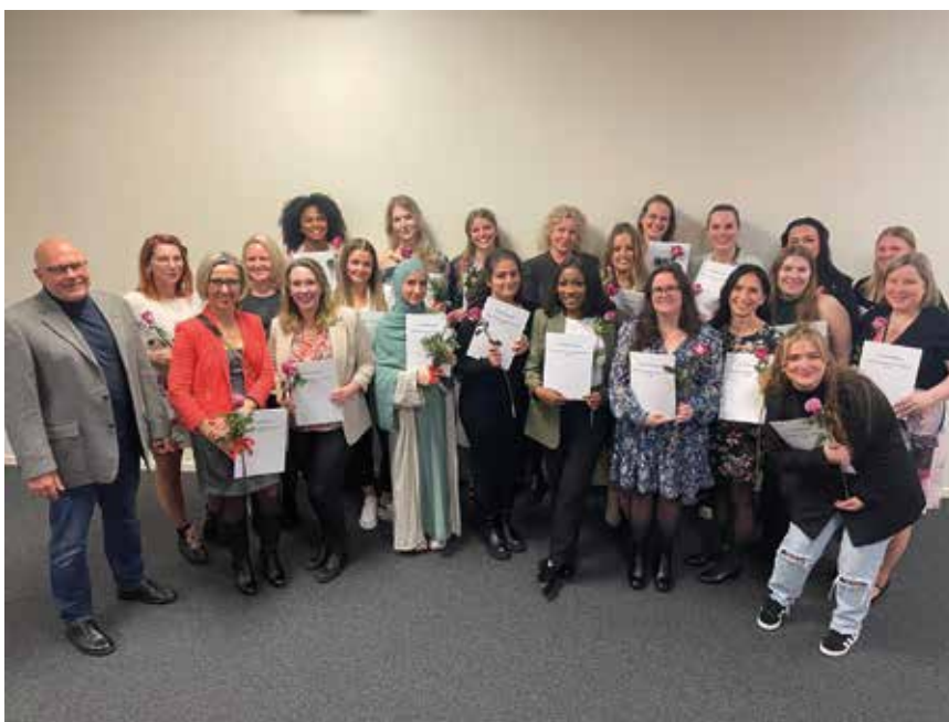
Die Aufstiegsfortbildung ZMP erfreut sich großer Beliebtheit. Die nächste Möglichkeit die Aufstiegsfortbildung zu belegen, ist im September 2024.

Die Fortbildung umfasste sowohl theoretische als auch praktische Einheiten, um uns umfassend auf die Anforderungen des Berufs vorzubereiten. Die Dozenten legten großen Wert darauf, dass wir das theoretische Wissen nicht nur verstehen, sondern auch in der Praxis anwenden konnten.