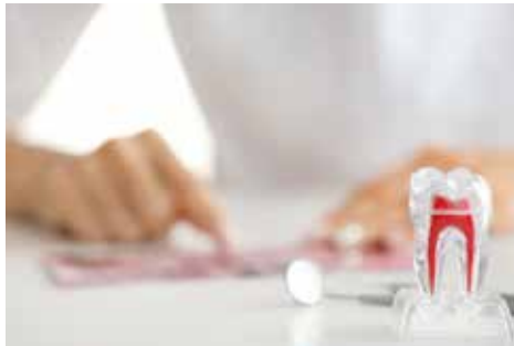
Die Klienten der Agentur schätzen die Zusammenarbeit mit einem qualifizierten Ausbilder

In Vietnam gibt es über 300 Sprachschulen. Die Jugendlichen absolvieren Sprachkurse im Lande und werden in einem Zeitraum von 8 - 12 Monaten auf einen Kenntnisstand gebracht, der es ihnen ermöglicht, die Ausbildung in Deutschland aufzunehmen. Künftig werden Auszubildende im Rahmen eines Sprachprogrammes der Agentur schon ein bis drei Monate vor dem offiziellen vertraglichen Ausbildungsbeginn nach Deutschland kommen können, um zusätzlich die Sprache direkt vor Ort zu vertiefen.