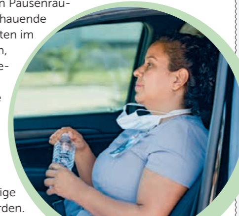
73 Prozent bekommen bei Hitze kostenlos Getränke.

Die Deutsche Allianz Klimawandel und Gesundheit e. V. (KLUG) ist ein Zusammenschluss von Einzelpersonen, Organisationen und Verbänden aus dem Gesundheitsbereich, die darauf aufmerksam machen, welche Folgen der Klimawandel für die Gesundheit hat – und Impulse für gesellschaftliche und politische Veränderungen geben. Sie haben hilfreiche Tipps zusammengestellt, wie Beschäftigte sich selbst bei Hitze schützen – oder vom Arbeitgeber geschützt werden können. Zu letzterem gehört zum Beispiel das Ermöglichen von Abkühlungen in Form von kostenlosen Getränken und kühlen Pausenräumen sowie eine vorausschauende Planung: Hitzewellen sollten im Team besprochen werden, Schulungen und Infomaterial helfen, das Team vorzubereiten. Der Deutsche Wetterdienst bietet die Möglichkeit, Hitzewarnungen zu abonnieren. Sofern es möglich ist, sollte das Raumklima beeinflusst und regelmäßige Pausen gewährleistet werden.