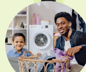
Wäscheberge sind geduldiger, als man denkt.

Der nächste Schritt: Abschied von der Perfektion. Kein Kindergeburtstag braucht eine mehrstöckige Torte,