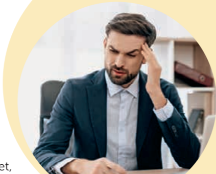
19 Prozent haben bei Hitze Gesundheitsprobleme.

Für den Gesundheitsreport wurden über 7.000 Beschäftigte bundesweit online befragt. Demnach fühlen sich 63 Prozent bei der Arbeit durch Hitze belastet, knapp ein Viertel sogar stark. Mehr als die Hälfte gibt an, bei hohen Temperaturen nicht so produktiv wie üblich zu sein, und 42 Prozent haben Konzentrationsschwierigkeiten. Ein Fünftel berichtet sogar über gesundheitliche Probleme. Dabei sind Symptome wie Abgeschlagenheit, Müdigkeit, Schlafprobleme, Kreislaufbeschwerden, Kopfschmerzen und Atembeschwerden typisch. Vor allem belastet sind Beschäftigte in den Bereichen Erziehung, Gesundheits- und Sozialwesen, Verwal-