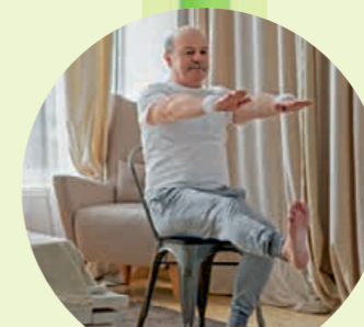
Bewegung einplanen, die Spaß macht.