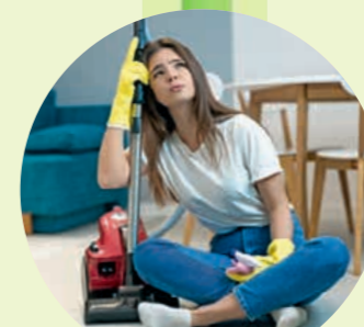
Statt zu putzen, einfach mal Pause machen.

auch eine einfache Backmischung, gepimpt mit individueller Deko, lässt Kinderaugen leuchten. Die Wohnung muss nicht durchgehend blitzblank sein und auch ein wachsender Wäscheberg ist geduldiger als vermutet.