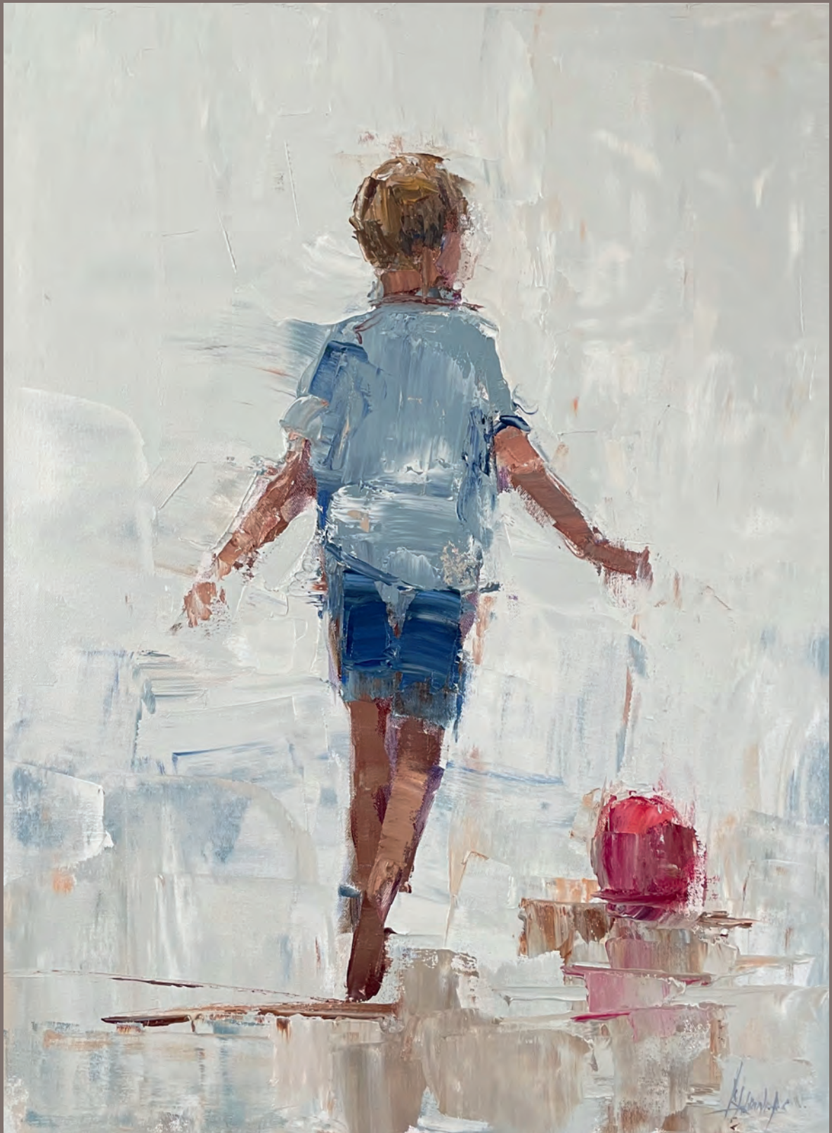
Barbara Flowers „Play“, Öl auf Leinwand, 61 cm x 46 cm, 2024