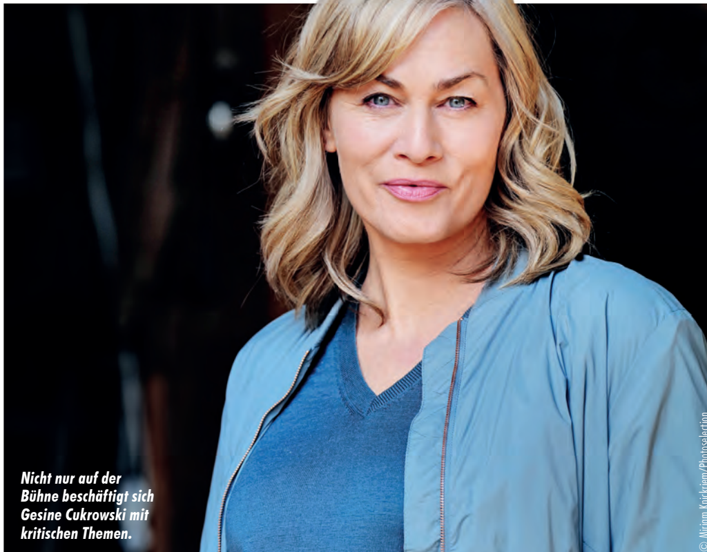
Nicht nur auf der Bühne beschäftigt sich Gesine Cukrowski mit kritischen Themen.