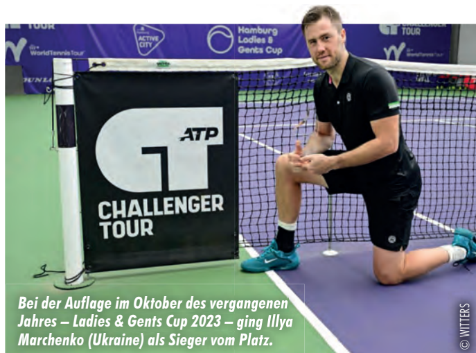
Bei der Auflage im Oktober des vergangenen Jahres – Ladies & Gents Cup 2023 – ging Illya Marchenko (Ukraine) als Sieger vom Platz.

Etwas früher als gedacht werden die Stars des internationalen Tenniszirkus zurück am Stützpunkt des Hamburger Tennis-Verbandes erwartet. Das bisher im Oktober ausgetragene Hallenturnier findet in dieser Saison für die Herren mit dem mit 36.900 Euro dotierten „ Challenger Hamburg “ vom 10. bis 17. März statt. Dem Turniersieger winken am Ende neben einem Scheck über 5.080 Euro auch 50 Punkte für die ATP-Weltrangliste. Am Sonntag, den 10. März startet die Qualifikation mit insgesamt 24 Teilnehmern. Die Spieler des 32-Mann-Hauptfeldes werden am Montag, den 11. März ins Geschehen eingreifen. Das Endspiel im Einzel ist Sonntag, den 17. März um 13 Uhr geplant. Zudem wird eine Doppelkonkurrenz mit 16 Teams ausgetragen. Wann: 10.-17.03., Wo: Stützpunkt des HTV, Bei den Tennisplätzen 77, Eintritt frei. Mehr Infos auf www.hamburger-tennisverband.de