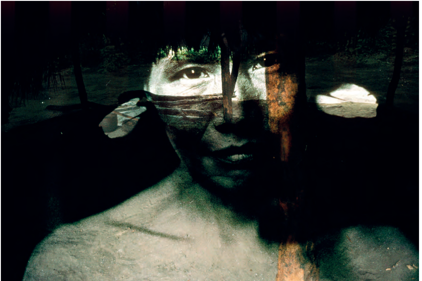
Opiq+theri, Perimetral norte - da série Sonhos Yanomami (2002)

Auch im Frühjahr haben die Hamburger Museen selbstverständlich wieder viel zu bieten. Wir präsentieren zwei spannende Ausstellungen , die Sie nicht verpassen sollten.