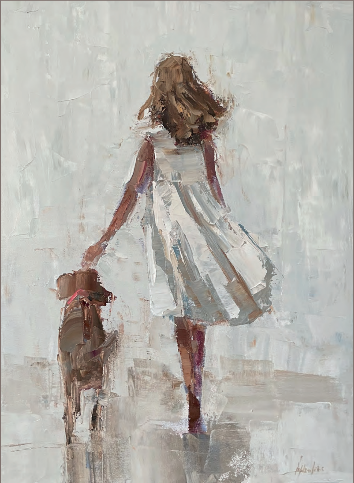
Barbara Flowers „A Girl and her Friend“, Öl auf Leinwand, 61 cm x 46 cm, 2024