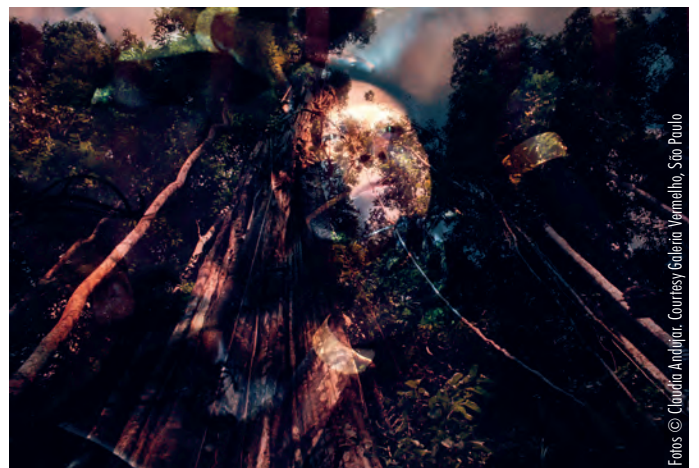
Floresta amazônica, Pará - da série Sonhos Yanomami (2002)

Eine Auswahl einiger Bilder und der wichtigsten Werkgruppen ihrer Fotos sind in der Ausstellung „The end of the world“ noch bis zum 11. August 2024 im PHOXXI zu sehen, dem temporären Haus der Photographie der Deichtorhallen.