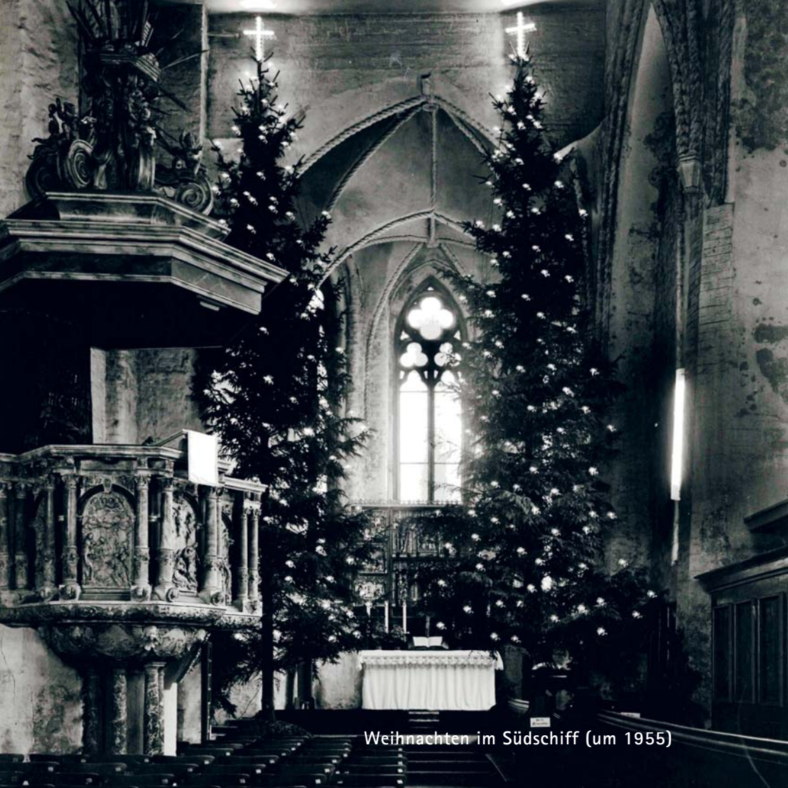
Weihnachten im Südschiff (um 1955)