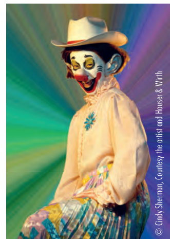
Cindy Sherman – Untitled #410, 2003

Phoenix Fabrikhallen, Wilstorfer Str. 71, Tor 2, Hamburg, www.deichtorhallen.de