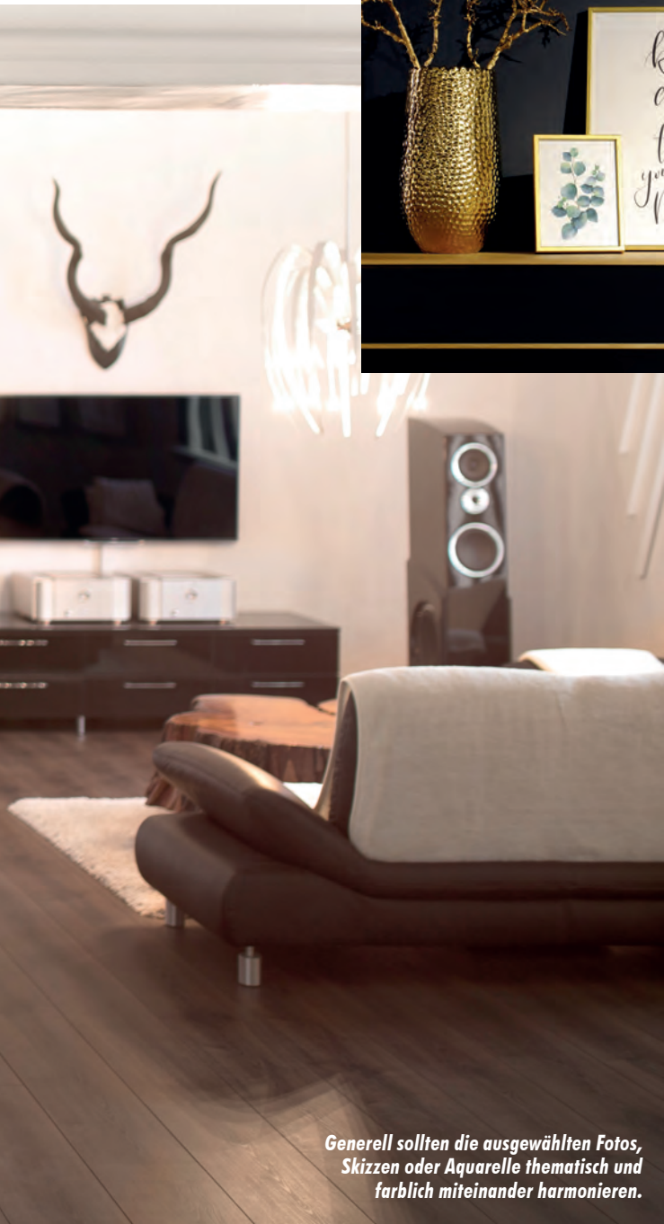
Generell sollten die ausgewählten Fotos, Skizzen oder Aquarelle thematisch und farblich miteinander harmonieren.