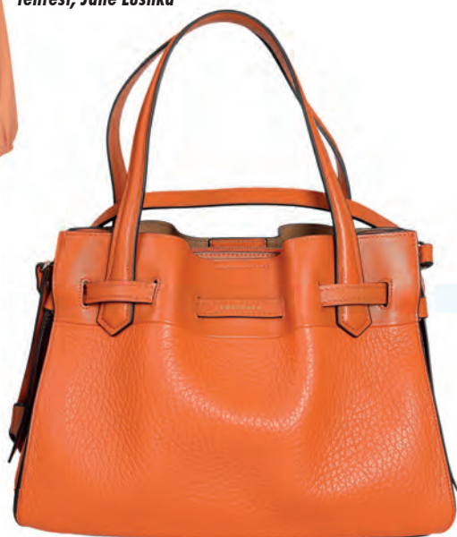
Ein Hingucker: Tasche aus genarbttem und glattem, hochwertigem Leder mit Alcantara Innenfutter, drei Fächer, 329€, Pourchet Paris (via myClassico)