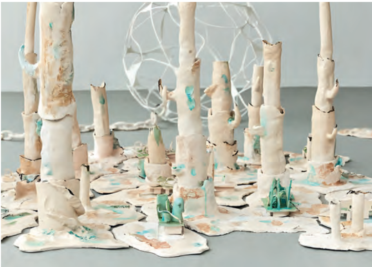
Anna Bochkova – Alien Commitment, 2023 (Detail)