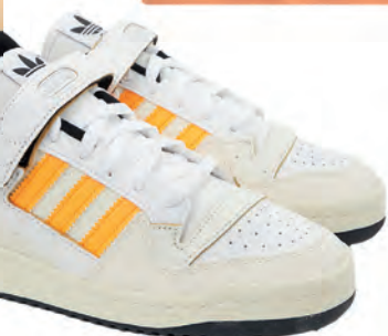
Cooler Retro-Sneaker mit ikonischen Streifen, 6-fach-Schnürung und Klettverschluss, 120€, Adidas (via myClassico)