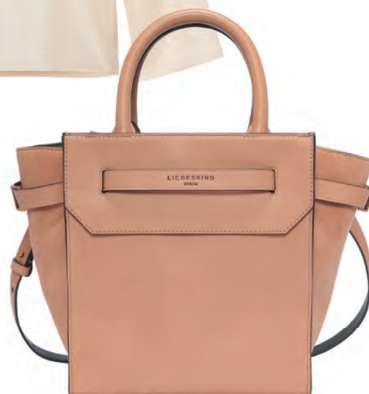
In verschiedenen Größen erhältlich ist diese hochwertige Ledertasche, 399€, Liebeskind Berlin