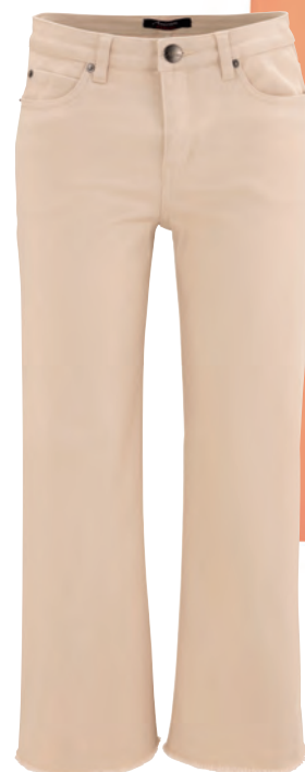
Super elastische 7/8 Jeans in der Farbe Sand, 59,99€, Aniston