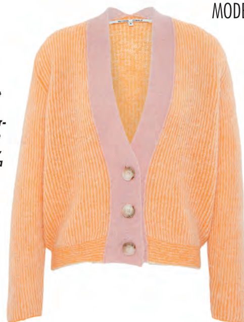
Der Cardigan aus weicher Mohair-Woll-Mischung mit V-Ausschnitt und Kontrastleiste überzeugt durch frische Farbtöne 169,90€, Second Female (via myClassico)