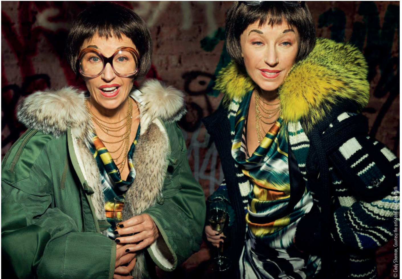
Cindy Sherman – Untitled #462, 2007/2008

Eis und Schnee haben uns überraschend im Griff ...nasskalt. Perfektes Wetter, um eines der Hamburger Museen aufzusuchen . Wir präsentieren zwei spannende Ausstellungen , die Sie nicht verpassen sollten.