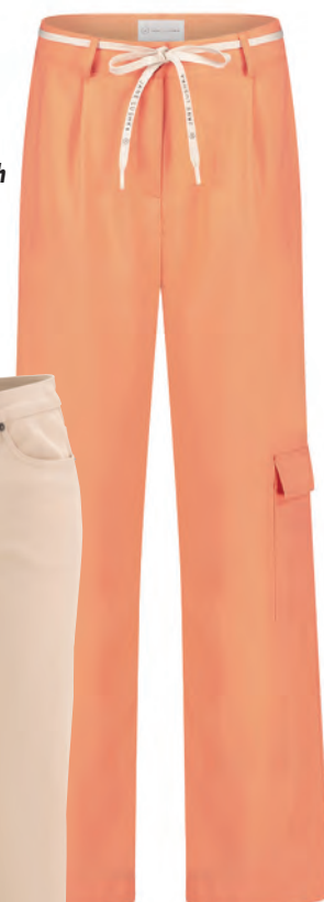
Vielseitig kombinierbar ist die Cargohose aus der SS24-Kollektion, die durch Material und Schnitt eine tolle Option für wärmere Tage ist, Jane Lushka