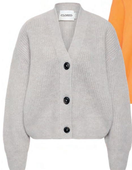
Strick Cardigan mit Alpaka im Oversized fit: wirkt lässig und edel zugleich, 225€, Closed (via myClassico)