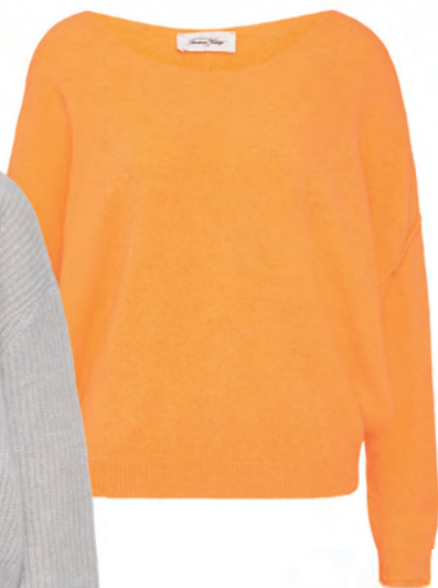
Der Pullover aus Wolle mit raffiniertem U-Boot Ausschnitt ist ein tolles Piece für laue Sommerabende, 100€, American Vintage (via myClassico)