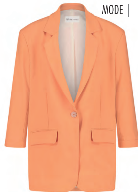
Blazer mal anders: Das Piece aus der neuen SS24-Kollektion erfrischt durch Farbe und Schnitt, Jane Lushka