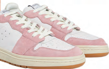
Die Low Sneaker aus einem Glatt- und Veloursleder-Mix könnten cooler nicht sein, 300€, Closed (via myClassico)