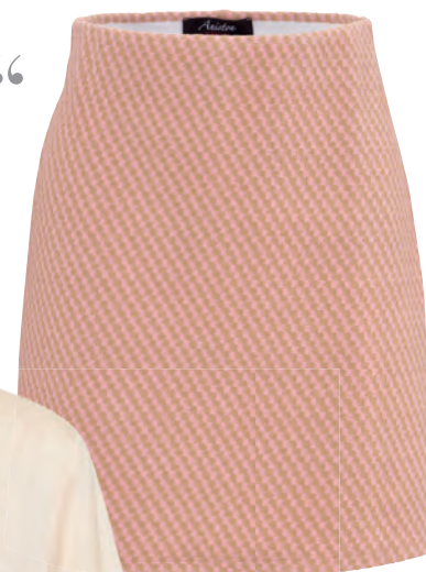
Der figurbetonte Mini-Rock im Karo-Design ist elegant und angenehm zu tragen, 39,99€, Aniston