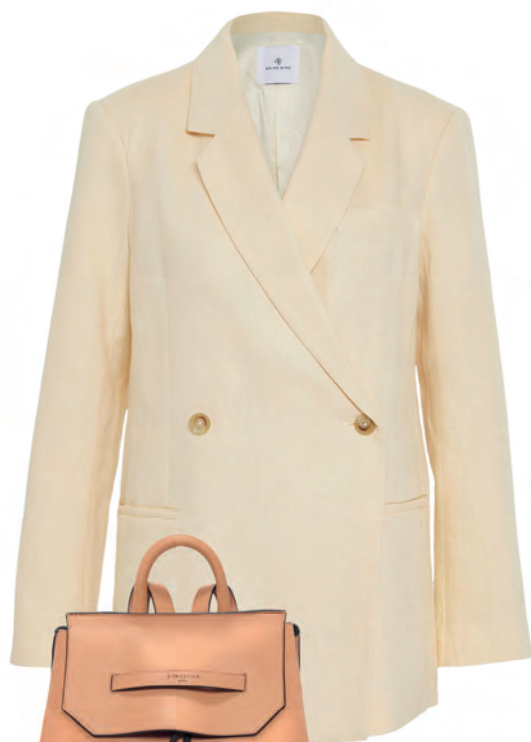
Casual-Chic: Blazer aus Leinen in Pastellgelb mit langer, lässiger Silhouette, 399€, Anine Bing (via myClassico)