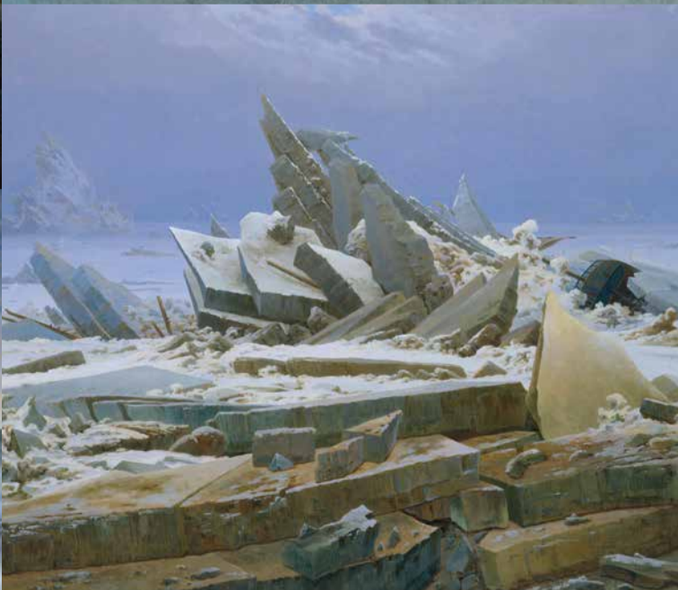
Vorderseite: 1 Wanderer über dem Nebelmeer (um 1817) 2 Mondaufgang am Meer (1822) 3 Zwei Männer in Betrachtung des Mondes (1819/20) | Diese Seite (v.l.n.r.): 4 Abend (1824) 5 Kreidefelsen auf Rügen (1818) 6 Gebirgslandschaft mit Regenbogen (1809/10) 7 Der Mönch am Meer (1808–1810) 8 Der Feldstein bei Rathen (1828) 9 Der Watzmann (1824/25) 10 Morgennebel im Gebirge (1808) 11 Selbstbildnis mit aufgestütztem Arm (um 1802) 12 Kehinde Wiley (*1977): Prelude (Babacar Mané) (2021) 13 Das Eismeer (1823/24)