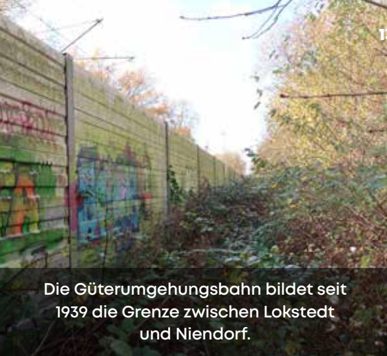
Die Güterumgehungsbahn bildet seit 1939 die Grenze zwischen Lokstedt und Niendorf.