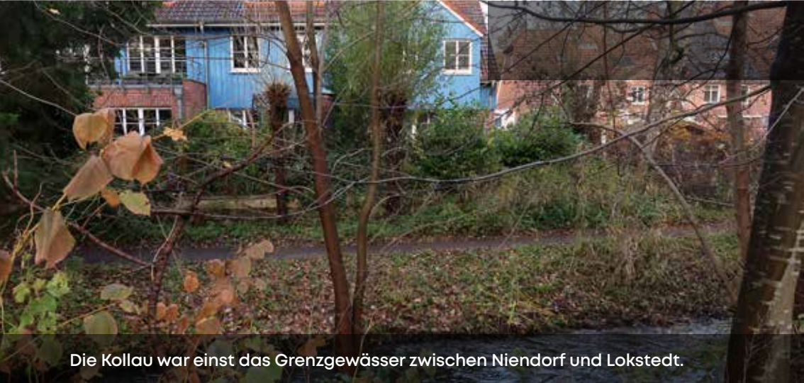
Die Kollau war einst das Grenzgewässer zwischen Niendorf und Lokstedt.

gebiet und besser unter dem griffigeren Namen „Tarpnebeker Ufer“ bekannt.