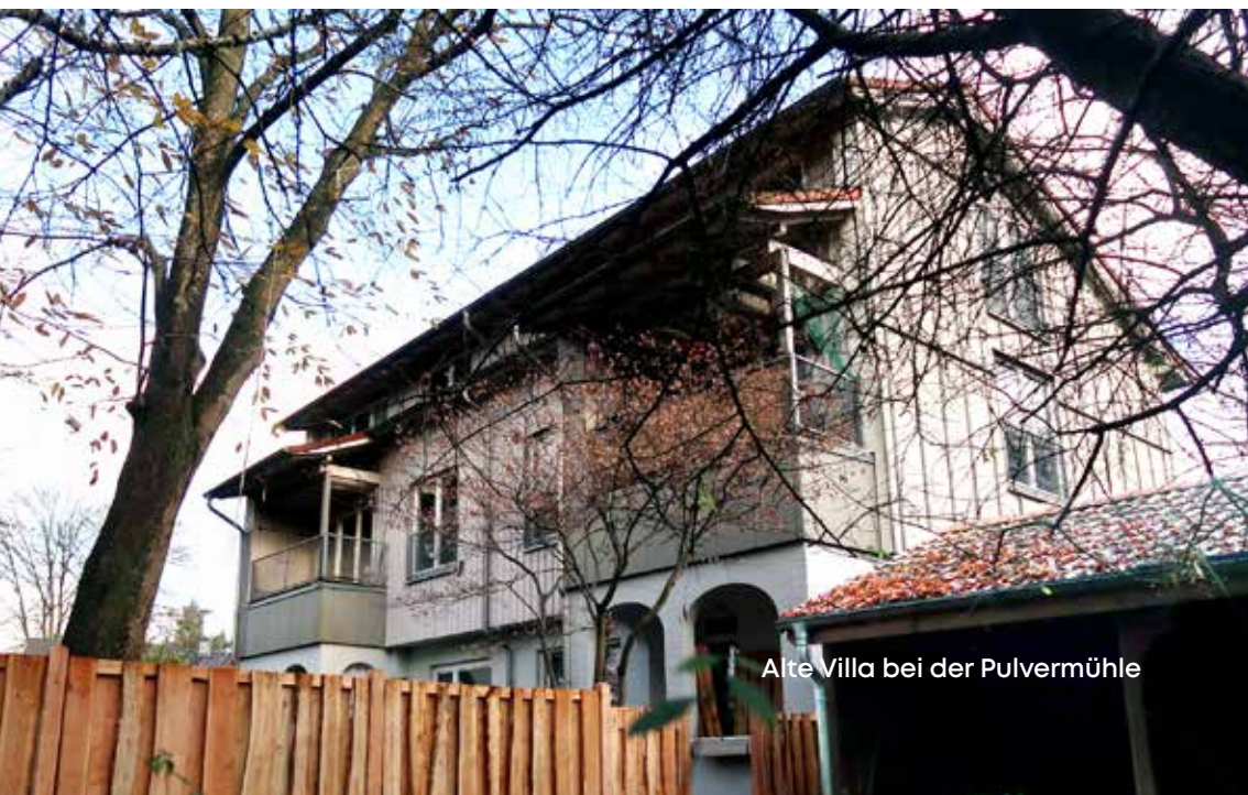
Alte Villa bei der Pulvermühle

Eine lange Zeit grenzte die Tarpenbek Groß Borstel von Niendorf im Westen und von Lokstedt im Westen und Süden ab. Die Kollau war das Grenzgewässer zwischen Niendorf im Norden und Lokstedt im Süden. Heute verlaufen die Verwaltungsgrenzen der drei Hamburger Stadtteile anders. So wurde im Zuge der Planungen für das Stadtentwicklungsprojekt „Groß Borstel 25“ die Grenze zwischen Groß Borstel und Lokstedt neu gezogen. Das Projekt „Groß Borstel 25“ ist nichts anderes als die Erschließung und Umwandlung des früheren Lokstedter Güterbahnhofes in ein Wohn-