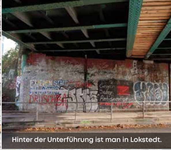
Hinter der Unterführung ist man in Lokstedt.