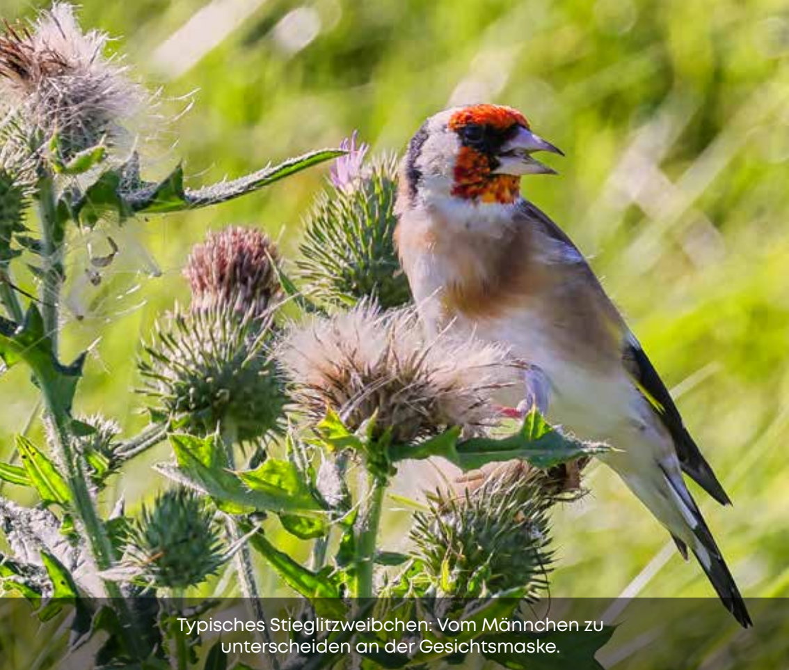
Typisches Stieglitzweibchen: Vom Männchen zu unterscheiden an der Gesichtsmaske.

für den Leidensweg Christi dar. So findet sich der Stieglitz auf vielen Gemälden des Mittelalters und der Neuzeit. Häufig wurde er auch in Bildern der Madonna mit dem Jesuskind oder der heiligen Familie gemalt. Oft hält dabei das Jesuskind einen Stieglitz in der Hand, zum Beispiel in dem Gemälde „Madonna mit dem Stieglitz“, gemalt 1506/07 von Raffael Santi. Außer der Taube als Symbol des Friedens und des Heiligen Geistes wurde wohl kein anderer Vogel in der Malerei so häufig dargestellt.