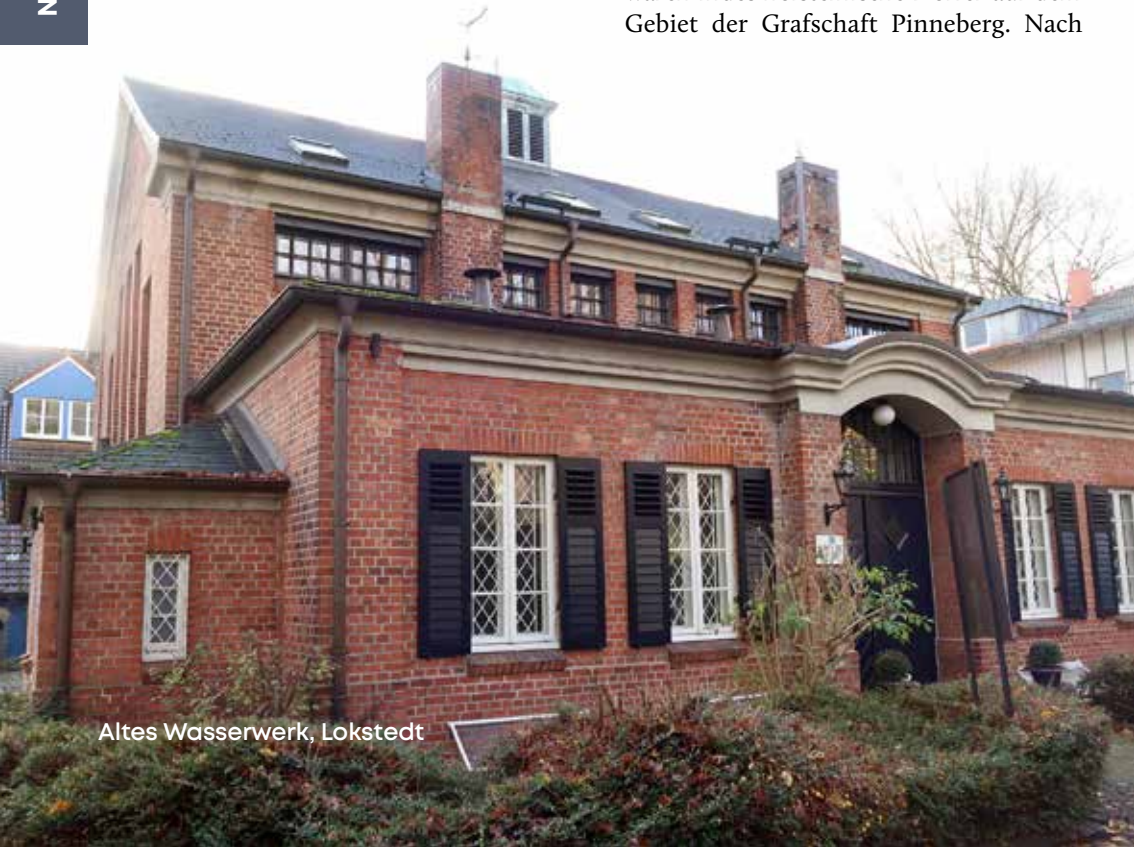
Altes Wasserwerk, Lokstedt

Groß Borstel gehörte seit 1325 zum Hamburger Landgebiet. Niendorf und Lokstedt waren indes holsteinische Dörfer auf dem Gebiet der Grafschaft Pinneberg. Nach