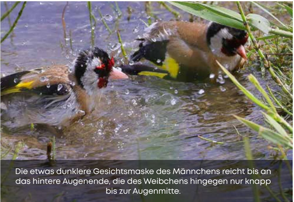
Die etwas dunklere Gesichtsmaske des Männchens reicht bis an das hintere Augenende, die des Weibchens hingegen nur knapp bis zur Augenmitte.

Ihre Geschlechtsreife erreichen Stieglitze bereits gegen Ende des ersten Lebensjahres und führen eine monogame Brutsaisonhe. Die Balz wird meist durch das Weibchen eingeleitet, indem es sich mit pendelndem Körper und Schnabelsenken dem Männchen nähert. Das Männchen lässt seinen Gesang ertönen, pendelt mit dem Körper und füttert das Weibchen. Darauf folgt die mehrmals am Tag stattfindende Kopulation. Nachdem das Weibchen in Begleitung des Männchens mehrere mögliche Nistplätze begutachtet hat, baut es sorgfältig in Baumkronen oder hohen Sträuchern das kleine napf-förmige Nest aus Halmen sowie Stängel. Dieses polstert es mit Moos,