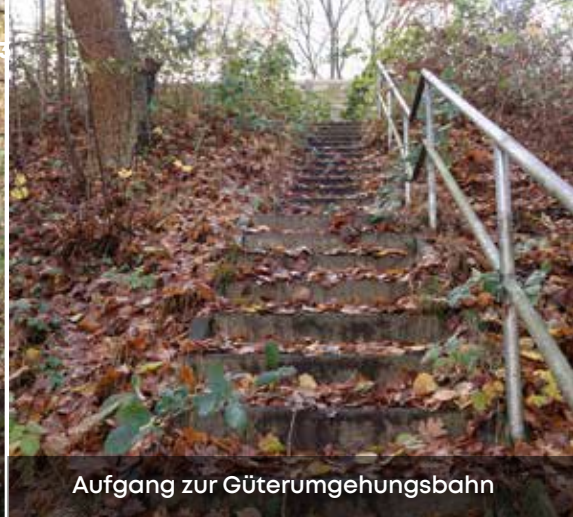
Aufgang zur Güterumgehungsbahn