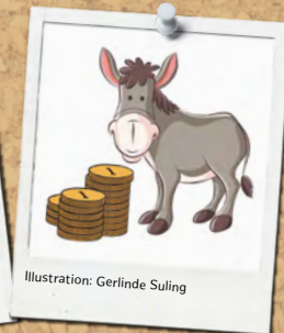
Illustration: Gerlinde Suling