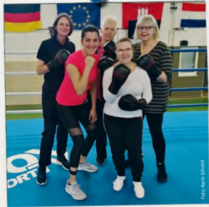
Vier von insgesamt zehn Frauen aus der Parkinson Boxgruppe.