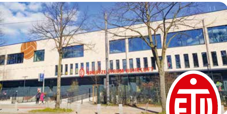
Das Sportzentrum des ETV am Lokstedter Steindamm wurde 2021 eröffnet