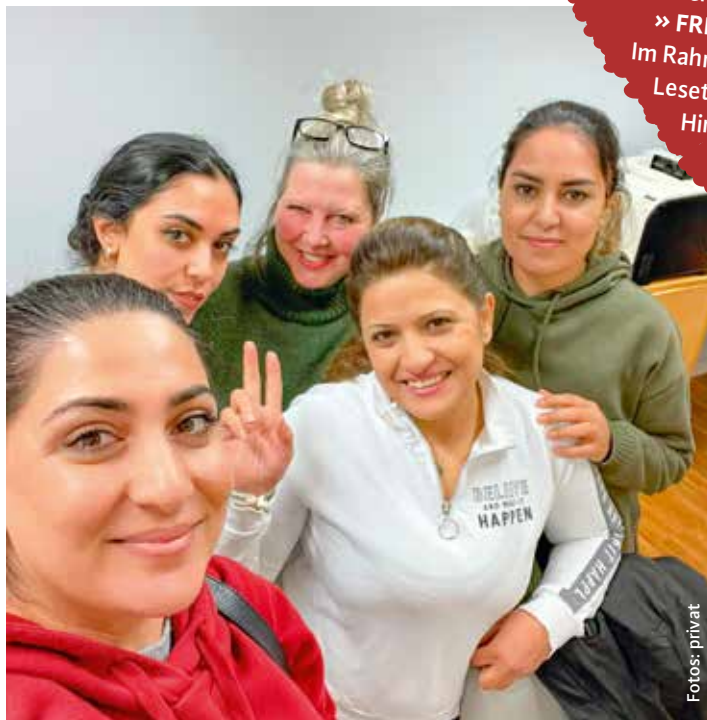
Bei den umfangreichen Angeboten entstehen Freundschaften