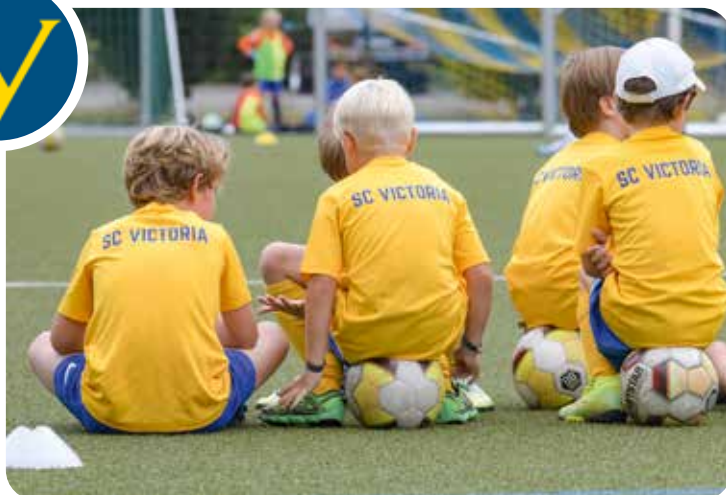
Beim SC Victoria kommen kleine Fußballer auf ihre Kosten