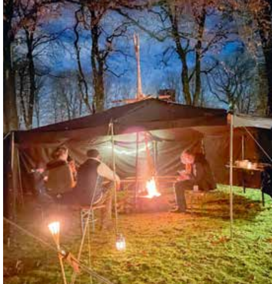
Gemeinsame Abende am Lagerfeuer gehören zu den Pfadfinder-Aktivitäten dazu

... verbreitete sich seit ihrer Begründung 1907 in England weltweit mit dem Ziel, Kinder und Jugendliche zu bestärken und sie zu befähigen, Verantwortung zu übernehmen und ihre Potenziale auszuschöpfen. Die Sippen des Stammes Bei der Lutherbuche treffen sich montags und mittwochs im Gemeinderaum der Christ-König-Kirche, Bei der Lutherbuche 36. Mehr Infos unter: mitmachen@stammlutherbuche.de , www.stammlutherbuche.de