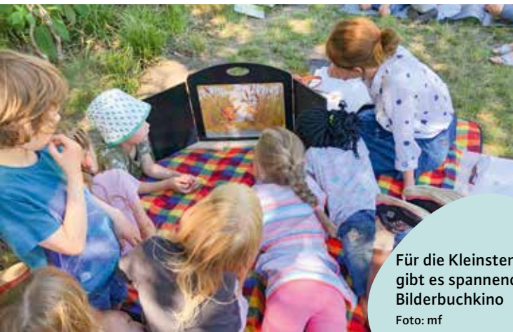
Für die Kleinsten gibt es spannendes Bilderbuchkino

außerdem in einer Lautschrift, mit deren Hilfe man den Originaltext aussprechen kann, ohne die Sprache selbst zu kennen. Zu finden ist die Ausstellung bis zum 30. Juni entlang des Zauns der Grundschule Hinter der Lieth. Hier findet am 23. Juni auch das Mitmach-Lesefest des Vereins Herzliches Lokstedt statt.