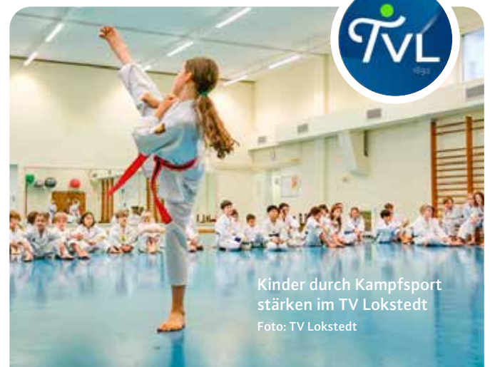
Kinder durch Kampfsport stärken im TV Lokstedt

wird mit Ballsport, Geräte- oder Leistungsturnen, Outdoor-Sport, Ballett, Taekwondo, Leichtathletik und vielem mehr fit gemacht – auch Kampfsport kann ab fünf Jahren gelernt werden. Als Ausgleich zum stressigen Alltag stehen für Erwachsene unter vielen anderen auch Body- und Mind-Angebote zur Verfügung und für Sportler/-innen über 50 gibt es neben speziell zugeschnittenen Kursen auch Reha- und Herzsportgruppen unter ärztlicher Aufsicht.