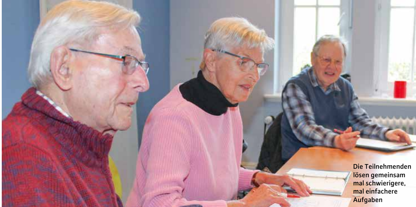
Die Teilnehmenden lösen gemeinsam mal schwierigere, mal einfachere Aufgaben