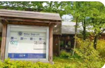
Das Alster Dojo liegt verwunschen im Veilchenweg

Kyūdō, die Kunst des Bogenschießens, Kendo, der Schwertkampf, das Fechten mit Lanzen Sōjutsu und Iaidō, die Kunst des Schwertziehens, gelehrt. Das Dojo verfügt auch über einen japanischen Teeraum, und vom Zuschauerhügel aus können Besucher/-innen das Geschehen beobachten. Da das Dojo ein Teil japanischer Kultur ist, gelten hier auch die obligatorischen Verhaltensregeln wie das Ausziehen der Schuhe oder das Verbeugen vor dem Betreten der Übungsräume. In Japan werden Kampfkünste wie Kendo nicht einfach als Sport, sondern zur Reifung des Charakters betrieben.