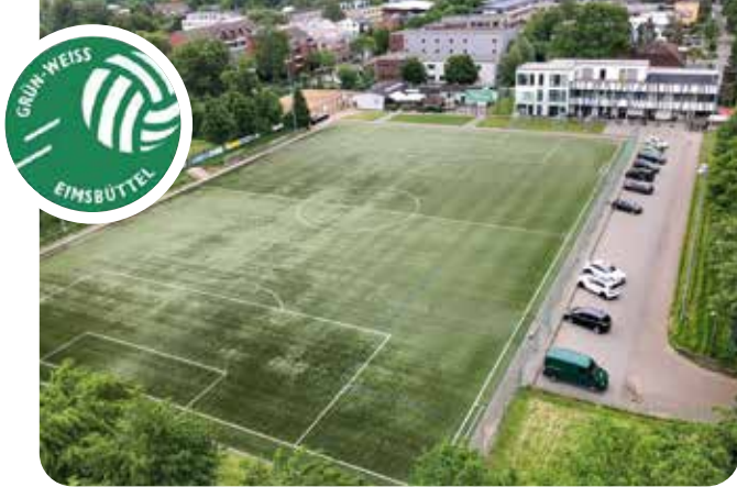
Viel Platz zum Kicken gibt's bei Grün-Weiß Eimsbüttel