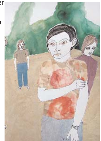
Ausschnitt aus einer Collage von Mette Thiessen

Drei Künstlerinnen beschäftigen sich mit Innen- und Außenwelten, mit Grenzziehungen, mit ihren und den Welten anderer, mittendrin und mittendrin fremd. In ihren Arbeiten setzen sich Menschen ins Verhältnis zu sich selbst, um sich zu verhalten. Manchmal eins mit der Umgebung, die da ist, bisweilen außerhalb und losgelöst, einsam und entfremdet. Bisweilen wirkt der Raum übergroß und riesenhaft, dann aber auch beherrschbar und geklärt. Public.Private.Intimate. Räume verschieben sich, verändern sich, werden neu gedeutet durch die persönliche Bezugnahme, das Inangriffnehmen wird zum Besitz oder Verlust. Diese Menschenräume sind szenisch, metaphorisch oder skulptural. Alle erzählen sie von Erfahrungen und Befindlichkeiten.