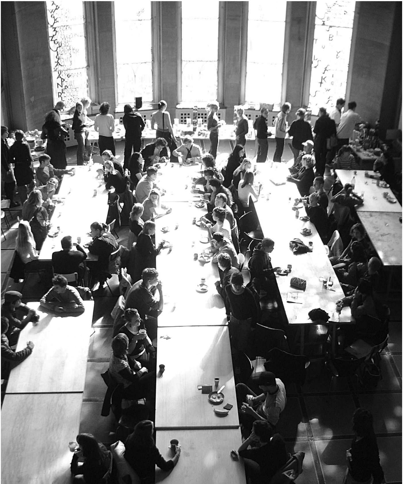
„Information, Orientierung und Trost“, 1.-Semesterfrühstück des AStA am Montag, 11.10., 12 Uhr, HfbK, Lerchenfeld, Eingangshalle