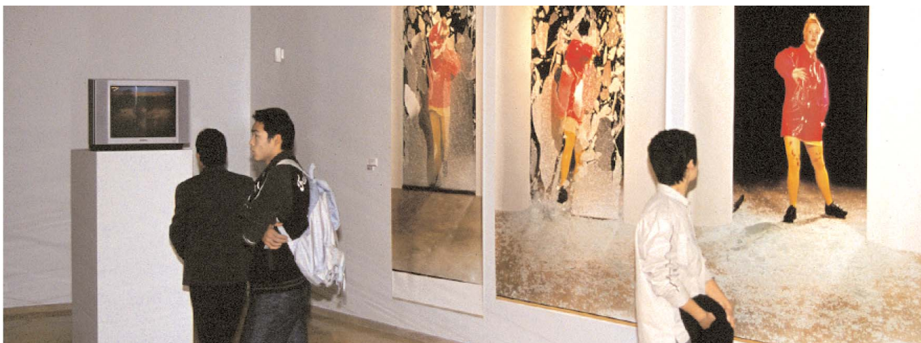
„Birnen, Bohnen und Speck“, durch die Ditze-Stiftung geförderte Ausstellung mit Arbeiten von 18 Lehrenden der HfbK im November 2001 im Shanghai Art Museum während der Kulturwoche der Stadt Hamburg in Shanghai.

Die vier Förder-Hochschulen, Universität, HAW, TUHH und die HfbK stellten eine Auswahl ihrer von der Ditze-Stiftung geförderten Projekte vor. Die HfbK präsentierte darüber hinaus Arbeiten von mehreren Ditze-Diplompreisträgern in einer kleinen Ausstellung.