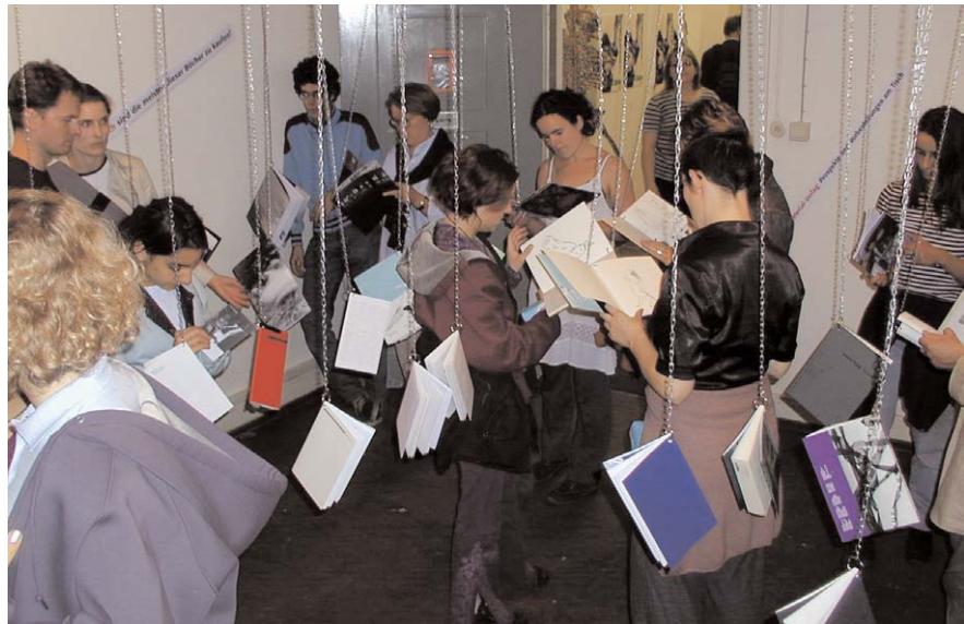
material-verlag auf der Jahresausstellung der HfbK

passo doble Doro Ottermann editionzeichnung 11 Original-Offset