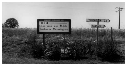
„Les Lanternes des Morts“ © Alexander Rischer