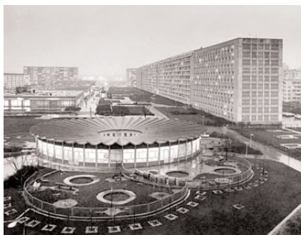
Kindergarten „Buratino“, Halle-Neustadt, 1968, Architekt: Erich Hauschild