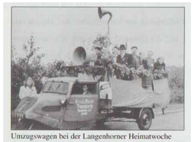
Umzugswagen bei der Langenhorner Heimatwoche

die Menschen damals sehr. So gut wie alle Vereine waren beteiligt, alle sozialen Verbände, Kirchen, Parteien und Organisationen, soweit sie schon wieder errichtet waren, machten mit. Um einmal einige zu nennen (manches kennt man heute kaum noch): Fünf Spielmannszüge, zwei Festplätze, Tanzzelte, Kasperletheater, Vorträge mit Lichtbildern, Plattdeutsches Theater, Lieder zur Laute, Hand-, Schlag- und Fußballspiele der diversen Mannschaften, Feuerwehr-Schauübungen, Feuerwehr-Vorträge, Staffettenlauf der Schulen, Fußballmannschaften von Fichte Langenhorn, Modenschauen, Volkslied-Konzerte der Langenhorner Gesangvereine, Abendmusik in der Ansgarkirche, Lichtbildvorträge der Naturfreunde, Platzkonzerte der Polizeikapelle, Boxveranstaltungen des Boxvereins „Heros“, Fußballspiel „Steuerzahler gegen Steuereinnahmer“, Handballspiele des HTSV, Heimatball in den Sälen von „Tomfort“ und im „Deutschen Eck“, Schwimmfest mit Wettschwimmen, Wasserball und Rettungsschwimmen im Freibad, Radrennen „Quer durch Langenhorn“, Fackelschwingen, Bewegungschöre, Männerchor und mehr bei der grossen Abschlussfeier. Während der ganzen Woche war Jahrmarkt auf der Festwiese und ein Schaufenster-Wettbewerb.