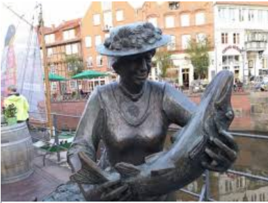
Die Skulptur der Fischersfrau „Mutter Flint“ in der Stader Altstadt.

Gut gelaunt und neugierig traten wir an Himmelfahrt mit der S-Bahn unsere Ausfahrt nach Stade an. Die Stadt gehört zur „Metropolregion“ Hamburg und liegt 45 Km westlich elbabwärts. Ihr Name kommt vom niederdeutschen STOOD und heißt: Gestade oder Ufer .