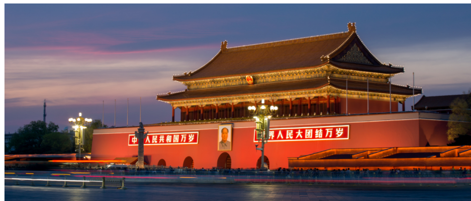
Tor am Tian'anmen-Platz in Beijing