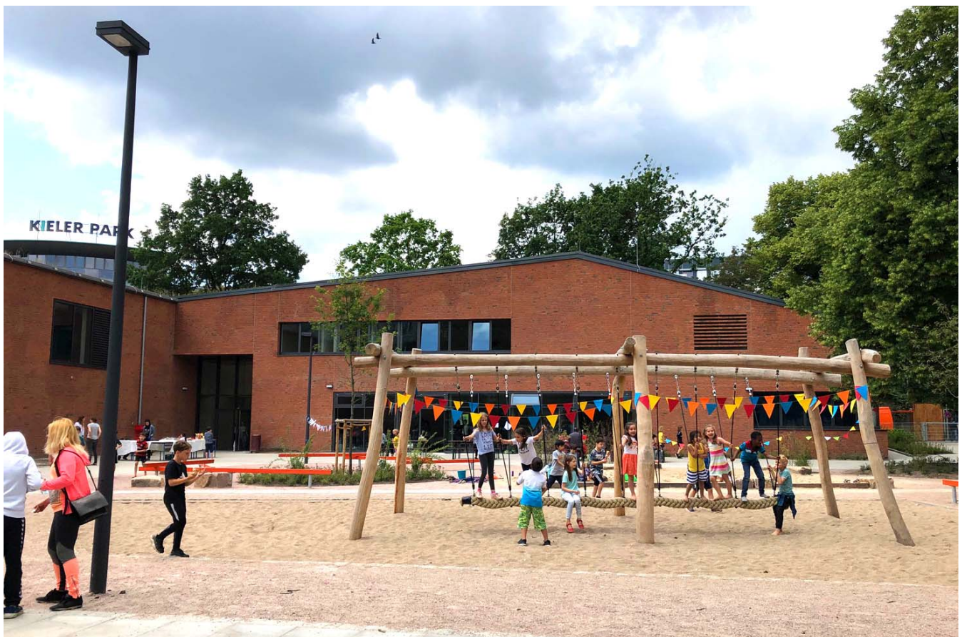
Neue Turnhalle der Schule Rellinger Straße (Sh. auch Kommentar auf Seite 3)

John Strauch: Kein "Weiter so" (Seite 6)