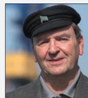
von Herbert Oetting

Das könnte meiner Meinung nach neben einem Stoppen der Pläne zur Rentenabsenkung ein Baustein sein, insbesondere die Situation der zukünftigen Altersrentner nicht weiter zu verschlechtern.