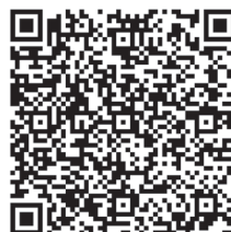
Handreichung „Kompetenzen in der Lehrkräftebildung für das Lernen in der digitalen Welt“

Es ist sehr hilfreich, ein persönliches Tablet oder kleines Notebook für die Arbeit im Seminar und in der Schule zur Verfügung zu haben, um digitale Seminaufgaben erfüllen oder die Bereitstellung von Arbeitsergebnissen zeitnah ausführen zu können.