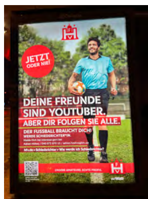
Das Plakat konnte man Ende Dezember in ganz Hamburg sehen