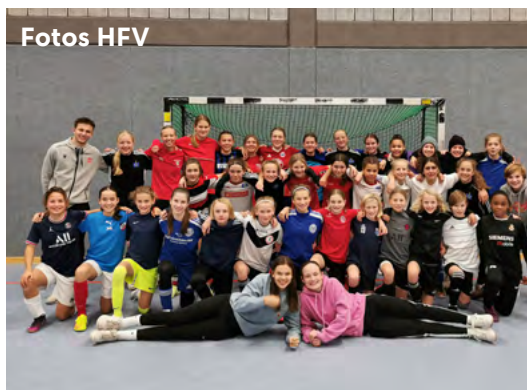
Die HFV U14-Mädchen