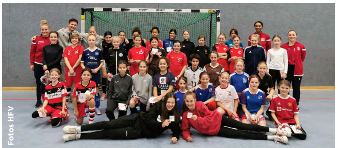
Weihnachtsturnier der U12- und U14-Mädchen-Stützpunkte