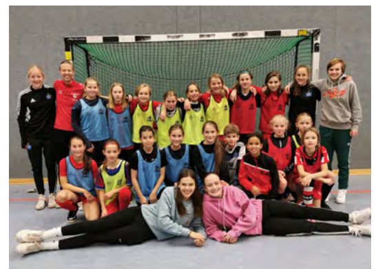
Die HFV U12-Mädchen