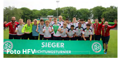
Sichtungsturnier