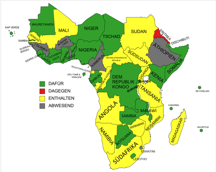
Abb. 3 Abstimmungsverhalten bzgl. der Verurteilung der russischen Aggression gegen die Ukraine in der UN-Generalversammlung vom 2. März 2022.