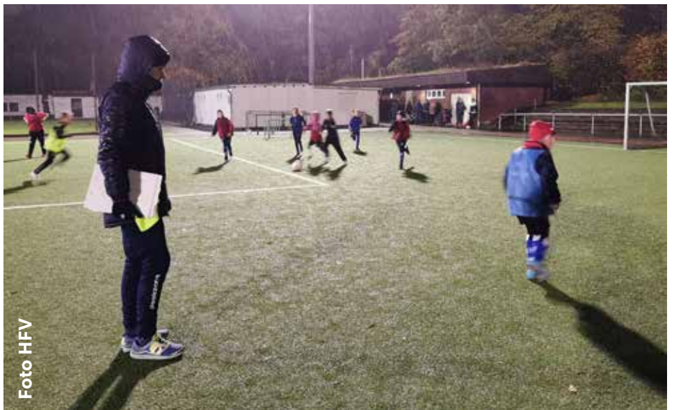
Schnuppertraining im Regen

Im Großen und Ganzen: ein toller Hamburger Schietwetter Fußball-Tag.