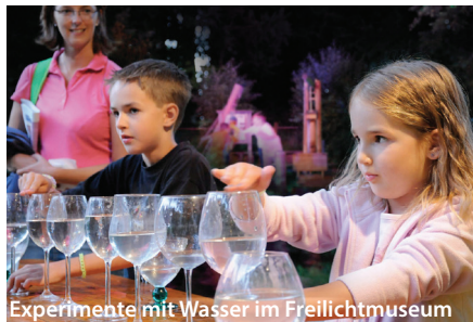
Experimente mit Wasser im Freilichtmuseum