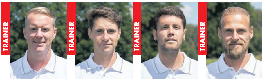
TRAINER TIMO SCHULTZ K. POHLERS & A. SPIEGEL* TRAINER LOÏC FAVÉ LEONARD & SVEND BRODERSEN* TRAINER FABIAN HÜRZELER FABIAN BALICKI* TRAINER MARCO KNOOP ALEXANDER RISTIOW*