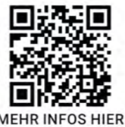
MEHR INFOS HIER

MEHRFAMILIENHÄUSER / GEWERBEIMMOBILIEN / NEUBAUPROJEKTE Individuelle Preise