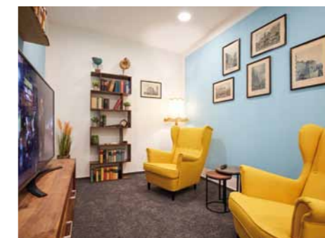
Exklusiv: Unser Hörerlebnisraum

Die Auswahl eines Hörakustikers ist Vertrauenssache – vergleichbar mit der des Hausarztes. Wir nehmen uns Zeit für Sie und Ihre Ohren, legen Wert darauf, Ihre Situation wirklich zu verstehen. Als inhabergeführtes Fachgeschäft mit familiärem Charakter grenzen wir uns damit bewusst von den großen Ketten ab. Was macht einen guten Hörakustiker aus? Dass er Ihnen zuhört und Sie wirklich versteht. Dass Sie ihm vertrauen können, sich