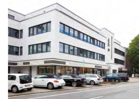
Parkplätze direkt vor der Tür

Wir möchten Ihre Partner sein, gerne ein Leben lang. Bei uns werden Sie stets ein vertrautes Gesicht vorfinden. Jemanden, der Sie mit Namen kennt und sich Zeit nimmt – auch wenn Sie Ihr Hörgerät nicht bei uns erworben haben. Vereinbaren Sie einfach einen Termin.