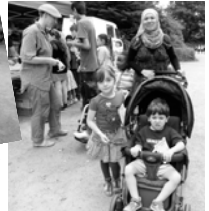
Ob Rollstuhl oder Kinderkarre: Dabei sein war alles.