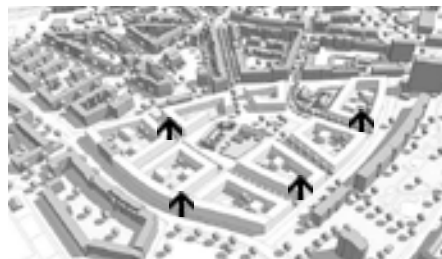
Das Bild re. zeigt das Gelände heute, der Pfeil markiert die Kurt-Tucholsky-Schule. Bild li.: So könnte es in 20 Jahren aussehen. Die Pfeile markieren mögliche Neubauten.

Stadtteil Mitte-Altona umziehen soll, gibt es umfangreiche Pläne. Die Flächen der Kita, des Bauspielplatzes und der Kleingärten wurden dabei ebenfalls planerisch für eine mögliche Wohnungsbebauung ins Auge genommen. Große Pläne für unseren Stadtteil, die aber noch nicht in Beton gegossen sind, sondern im Dialog mit der Bevölkerung entwickelt