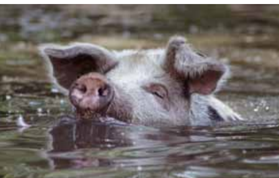
Tierischer Nachwuchs erwartet Sie im Tierpark „Arche Warder“

Unter dem Motto „Auf Touren kommen“ besuchen wir einmal im Monat wunderschöne Orte im Hamburger Umland.