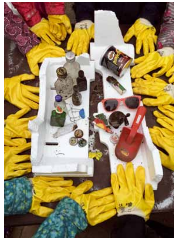
Jedes Jahr als fleißige Müllsammler mit dabei: Die Kinder der Schule Arnkielstraße

Dann kann das Aufräumen losgehen und Sie können mit Ihrem Team starten. Die gefüllten Müllsäcke werden von der Stadtreinigung Hamburg an dem von Ihnen vorab angegebenen Ort abgeholt. Unter allen Teilnehmer-Gruppen werden tolle Sachpreise verlost, die von Hamburger Unternehmen gestiftet wurden. Mit etwas Glück können Sie zum Beispiel Freikarten für Alma Hoppe, das Ohnsorg-Theater oder das Altonaer Museum gewinnen. Spannung und Action verspricht ein kostenloser Besuch im Kletterpark, im Hamburg Dungeon oder im Erlebnisbad Arriba. Und für das leibliche Wohl winken Gutscheine für einen Besuch im Block House, für einen Ayurveda Kochkurs oder