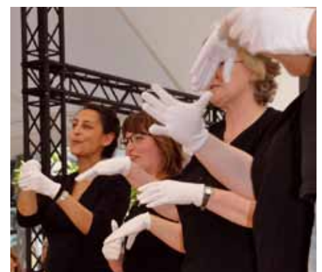
Gebärdenchor „Hands up“ im Einsatz

treffpunkt.altona, Große Bergstr. 198 Donnerstags 17.00-19.00, 15.3., 19.4., 3.5. Anm.: i.helke@alsterdorf-asistenz-west.de Tel. 22 63 42 310