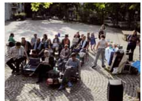
Der Internationale Handtuchtag - ein Muss für alle Douglas-Adams-Fans

Sobald das Wetter besser wird, soll auch wieder am 1. Sonntag im Monat ab 18.00