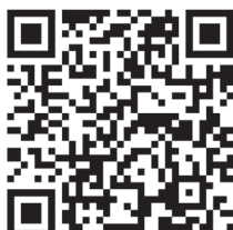
Sexualerziehung und Gender

Felix-Dahn-Str. 3, 20357 Hamburg Besucheradresse: Hohe Weide 16 E-Mail: sexualerziehung-gender@li-hamburg.de https://www.li.hamburg.de/sexualerziehung https://li.hamburg.de/sexualerziehung-gender/ https://www.li.hamburg.de/gender-jungen-maedchen