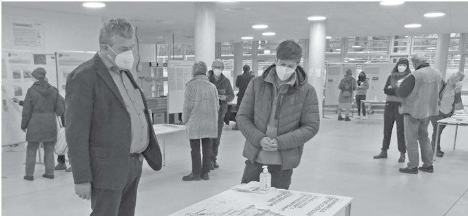
Kolleg*innen aus der RISE-Gebietsentwicklung und dem Bezirksamt Altona stellen Ziele und Projekte für das Integrierte Entwicklungskonzept vor.

te in den verschiedenen Handlungsfeldern der Gebietsentwicklung vor. Die Teilnehmenden hatten die Möglichkeit, Anmerkungen zu den Projekten zu machen und eigene Projektideen vorzuschlagen. Sinn der Veranstaltung war es, Projekte und Maßnahmen auf Zustimmung in der Bevölkerung zu prüfen sowie weitere Projektideen zu sammeln. Jetzt werden die Projektideen aus der Stadtteilwerkstatt #2 geprüft und gegebenenfalls konkretisiert, damit die Ergebnisse in die Gesamtstrategie für das Fördergebiet eingespeist werden können. Die Dokumentation der Stadtteilwerkstatt #2 ist auf der Website www.lurup.info unter Aktuelles & Termine sowie im Downloadbereich zu finden.