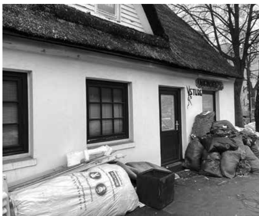
Am 17.12.2021 wurden diese Müllsäcke vor der Kate fotografiert. Auf dem weißen Sack ist der Hinweis aufgedruckt, dass Schutzkleidung beim Umgang mit Mineralwolle zu tragen ist.

Trotzdem wurde der vorhandene Schornstein abgebrochen, da nach der Aussage des Eigentümers akute Einsturzgefahr bestand. „Um eventuelle Gefahren für das Gebäude auszuschließen, ist das Provisorium durch eine fachgerechte Abdeckung des Lochs vom Schornstein zu ersetzen.“ Das ist offensichtlich bis heute nicht geschehen. Stattdessen lagen am 17.12.2021 Müllsäcke vor dem Haus – direkt am Gehweg an der Luruper Hauptstraße..