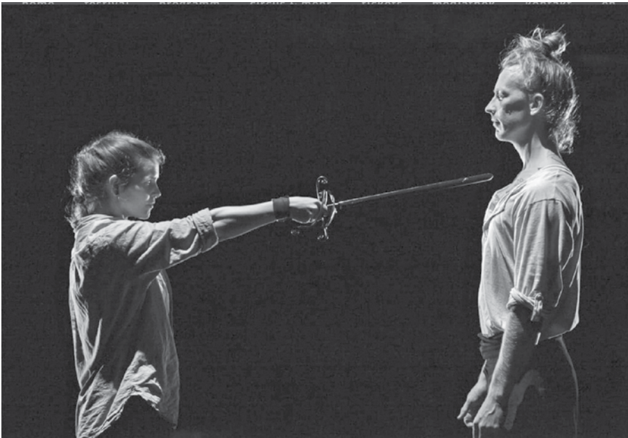
Wird sie das bereuen? Revue Regrêt bei der Europäischen Zirkusnacht