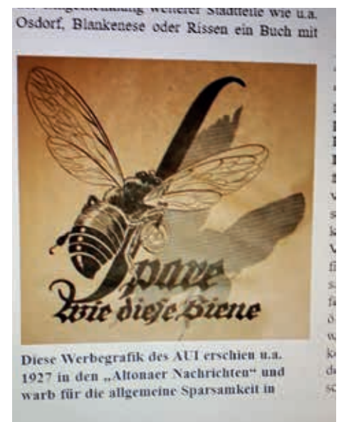
Werbegrafik: erschien unter anderen 1927 in den „Altonaer Nachrichten“ und warb für die allgemeine Sparsamkeit