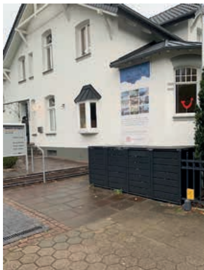
Der Sitz des Reisebüros von Daacke neben dem Hofladen

Hinter diesen Mauern residiert nun seit 2020, nach Aufgabe des Stammbüros am Nienstedtener Markt-