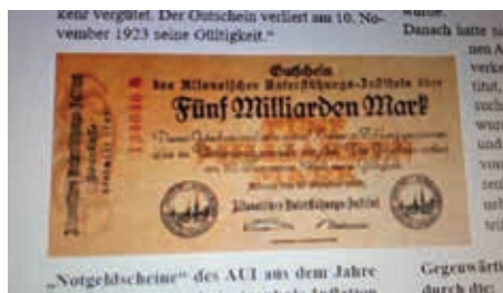
Notgeldschein des AUI aus dem Jahre 1923

Bald gab es Zweigstellen der AUI Sparkasse im ganzen Stadtgebiet Altonas, auch, wie oben bereits erwähnt, bei uns in Nienstedten.