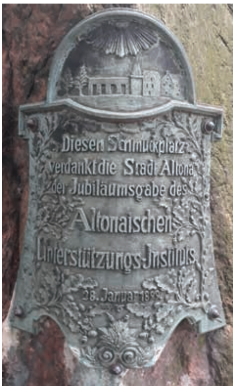
Erinnerungstafel gegenüber dem Altonaer Museum

Der Erste Weltkrieg und die folgenden schwierigen Jahre mit Arbeitslosigkeit, Not und Superinflation trafen auch Altona und seine Sparkasse. 1923 gab das AUI ein eigenes Notgeld heraus. Dann ging es langsam wieder bergauf. „Spar wie eine Biene“ war 1927 die Devise. Und das taten die Altonaer auch.