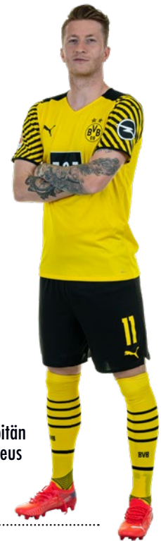
BVB-Kapitän Marco Reus