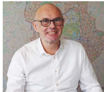
Michael Werner-Boelz © BA HH-Nord

Im vergangenen Jahr konnten wir zudem die Finanzierung für ein neues Schwanenquartier sichern. Das alte Schwanenquartier am Eppendorfer Mühlenteich und die bestehende Infrastruktur wird den aktuellen Anforderungen nicht mehr gerecht wird. In einem hochbaulich-freiraumplanerischen Wettbewerb haben wir deswegen eine zukunfts-