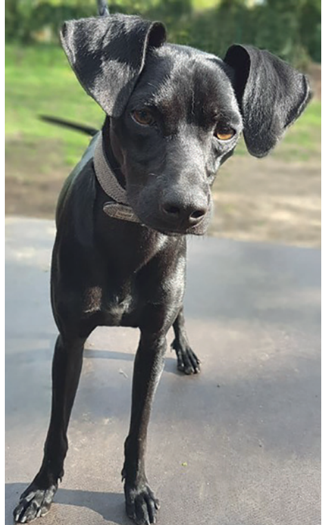
Mit kanarischem Temperament: Jumper!