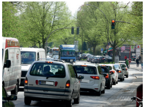
Unser tägliche Stau, die morgentliche Version.