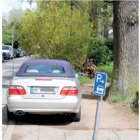
Kein Durchkommen für Rollstuhlfahrer, Briefträger und Kinderwagen