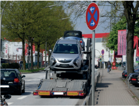
Seelenruhe beim Autoverladen im absoluten Halteverbot.

Nach der gut besuchten ÖPNV-Veranstaltung im März hat sich der Kommunalverein dem Thema Straßenverkehr auf seiner Facebookseite mit einer kleinen Umfrage angenähert: Was sind die größten Verkehrsprobleme in Groß Borstel?