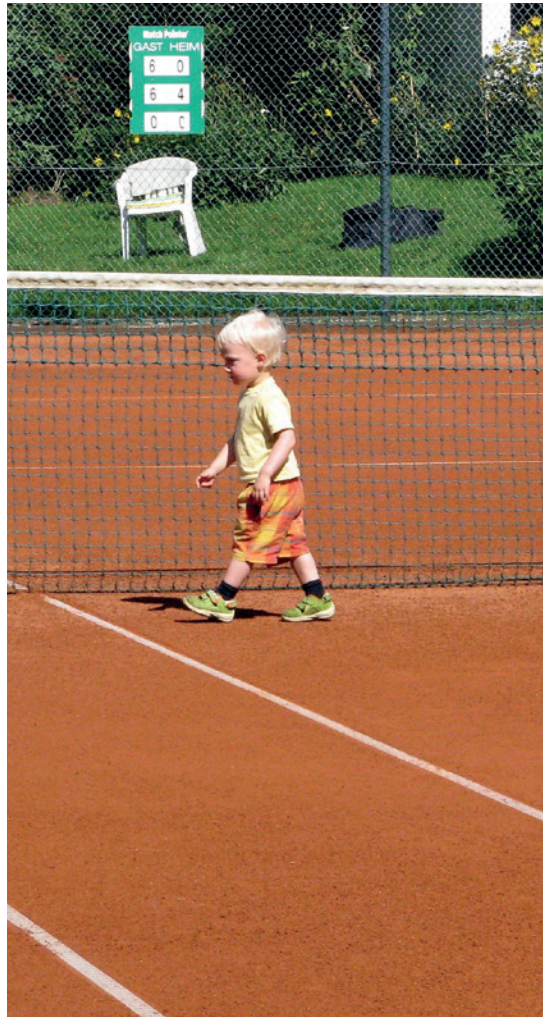
Wer rechtzeitig den Platz abschreitet ...