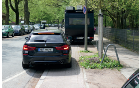
So schön kann man vor unserer Schule Falschparken. Und alles zu Ungunsten der Schulkinder.

von der Straßenverkehrsbehörde aber nicht umgesetzt. Und die Gehwegzustände sind für ältere Mitbürger eine Katastrophe. Ein Sturz bedeutet oftmals Pflegebedürftigkeit.