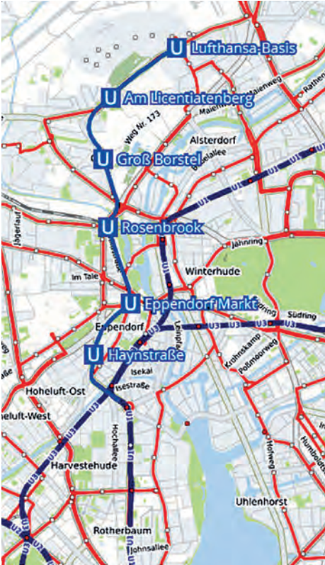
Streckenplan der U-Bahn-Linie 5

Geschichte Groß Borstel anliefen: die Straßenbahn. Es gab Direktverbindungen in die City und sogar eine direkte Linie, die von St. Pauli nach Groß Borstel führte, die Linie 14. Groß