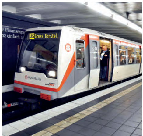
Photoshop macht's möglich

Folge: Groß Borstel erstickt im Verkehr, genauer gesagt im Motorisierten Individual Verkehr,