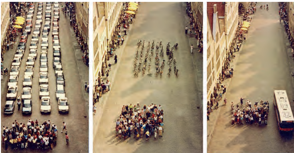
Verkehrsfächenverbrauch: Auto, Fahrrad, Bus

von Verkehrsexperten treffenderweise auch MIV genannt. Unglaublich viele steigen ins Auto, um mal eben die Kinder zur Schule zu bringen, Brötchen zu holen, einzukaufen, essen zu gehen.