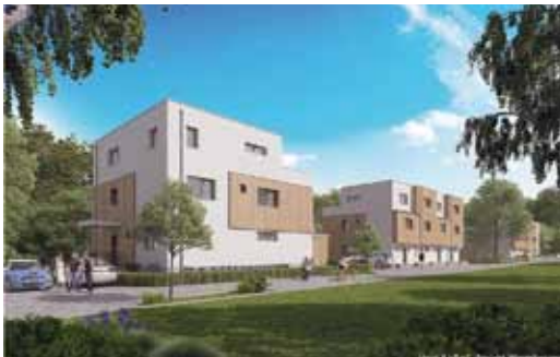
© 2017 Wohngenossenschaft Op De Deel eG. i.G.